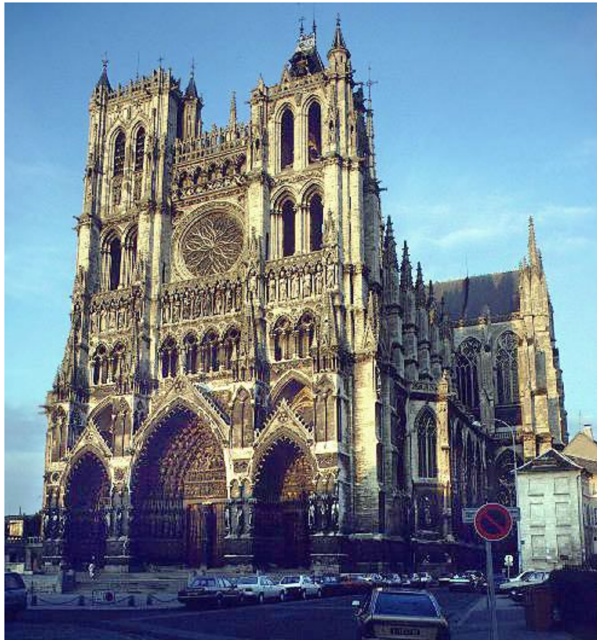
Собор в Амьене