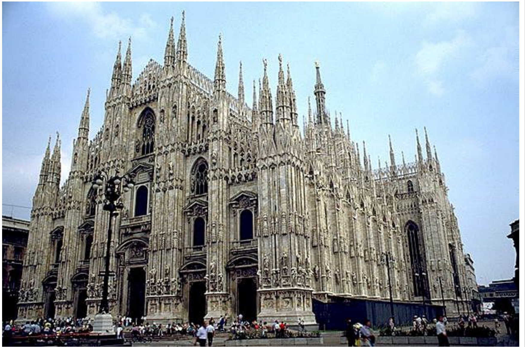
Готический собор в Милане.