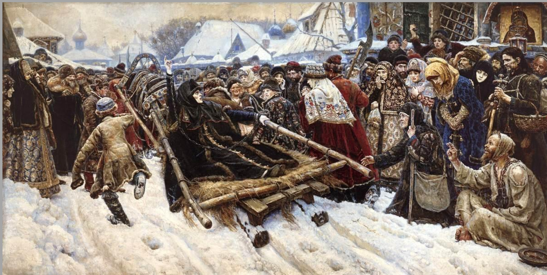
5.3. В.И.Суриков «Боярыня Морозова» 1887г.,х.,м., Государственная Третьяковская галерея