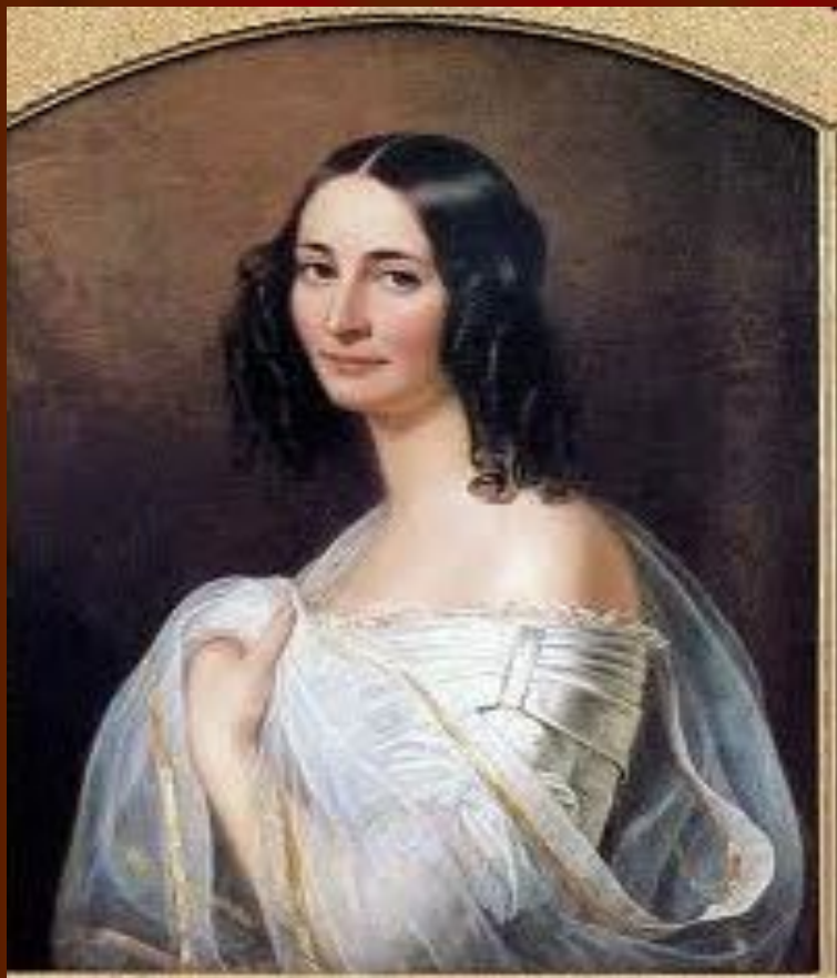
2-ая жена Э. Дернберг