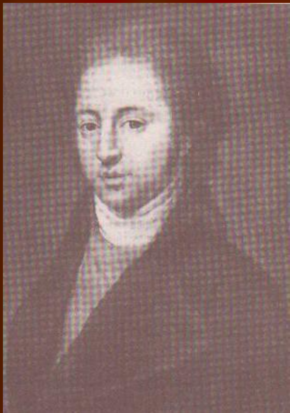
И.Н.Тютчев, отец поэта