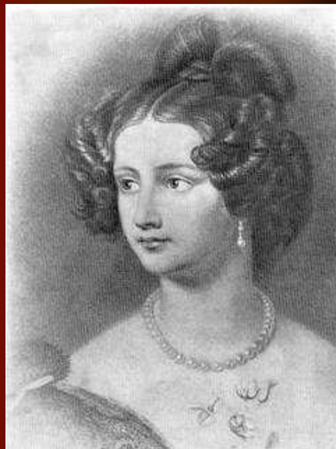
Амалия Крюденер. Фотография с портрета маслом работы художника И.Штилера. 1838 г