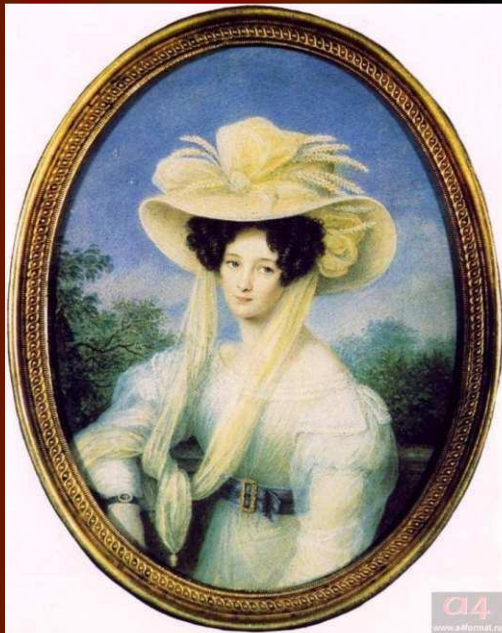
Элеонора Ботмер, первая жена Ф.И. Тютчева. Миниатюра И. Щелера. 1830-е