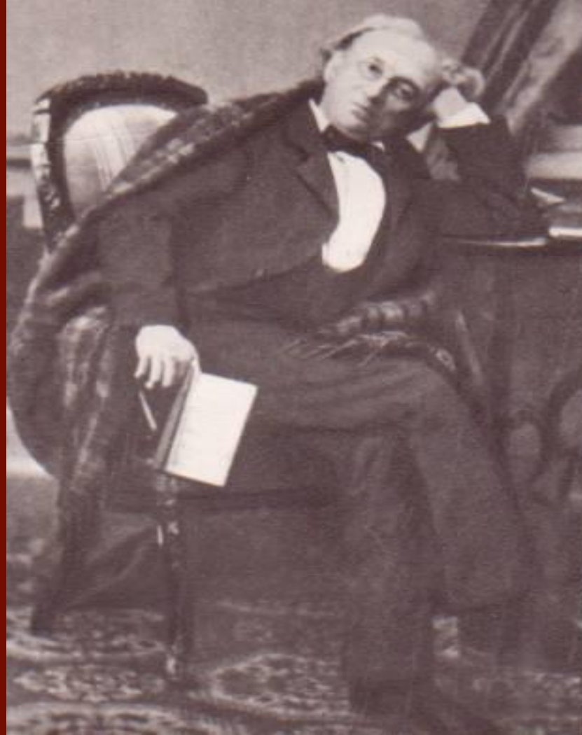
Ф.И.Тютчев. Конец 1860-х годов