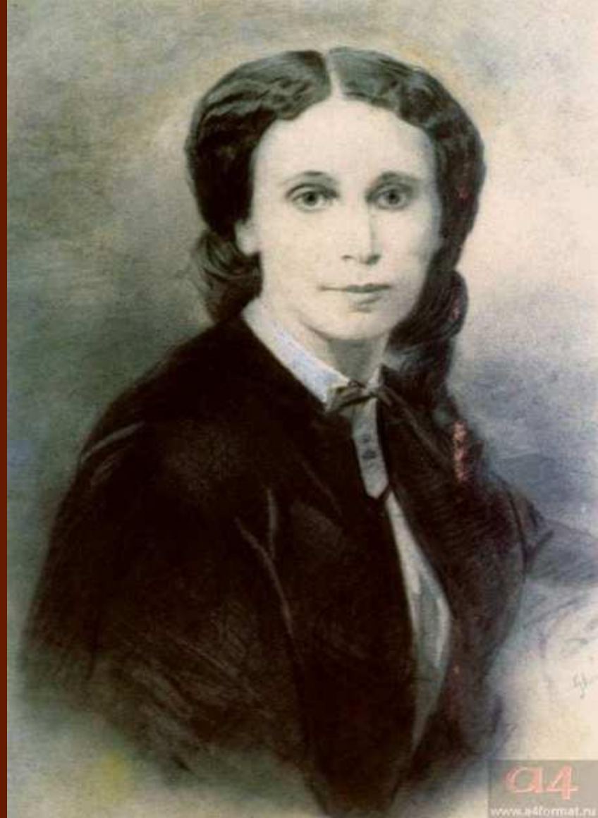
Е.А. Денисьева. Фото начала 1860-х