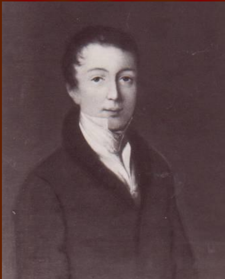
Ф.И.Тютчев в начале 1820-х годов