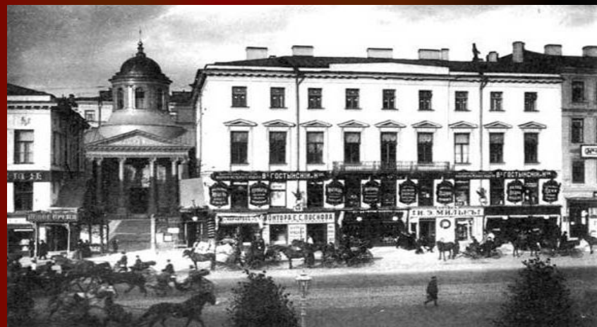
"дом Армянской церкви"

3 июля 1854 года Тютчев сообщает жене о квартире в доме Армянской церкви на Невском проспекте («четырнадцать прекрасных комнат с паркетными полами»)