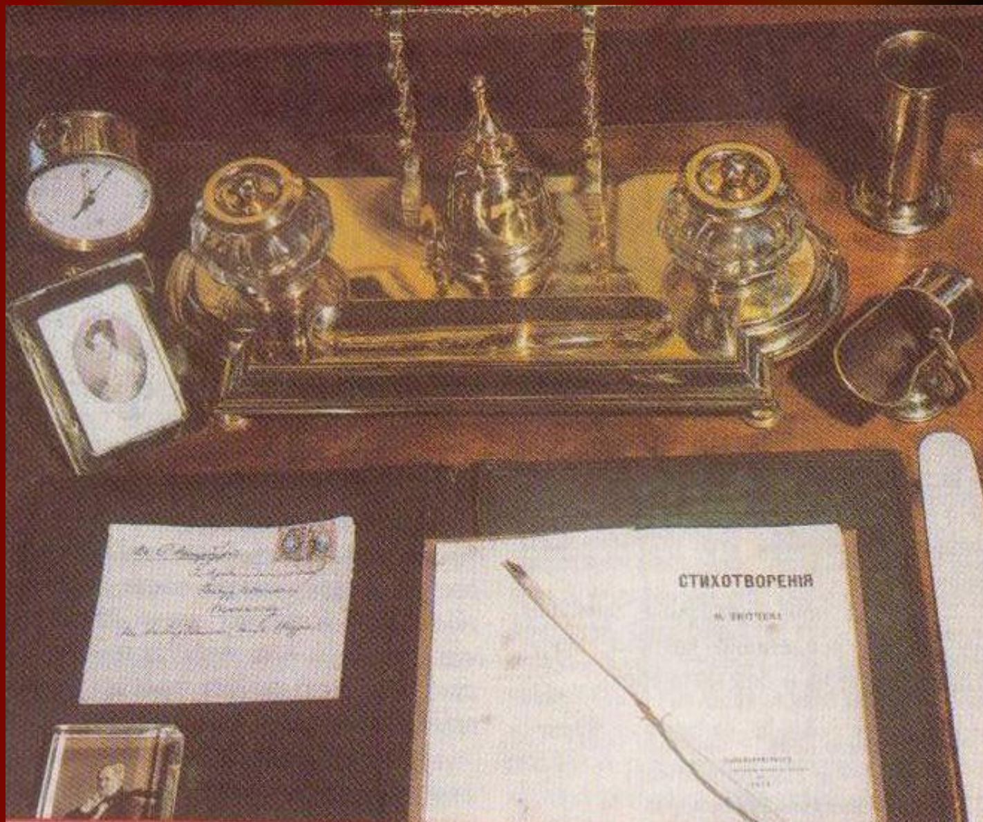
Личные вещи Ф.И.Тютчева. Музей-усадьба Мураново