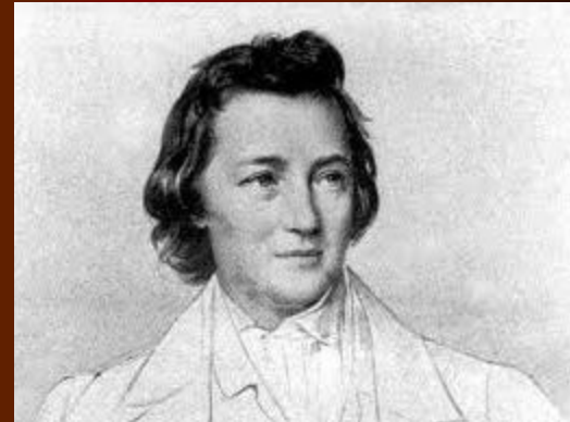
Г. Гейне 1797 - 1856