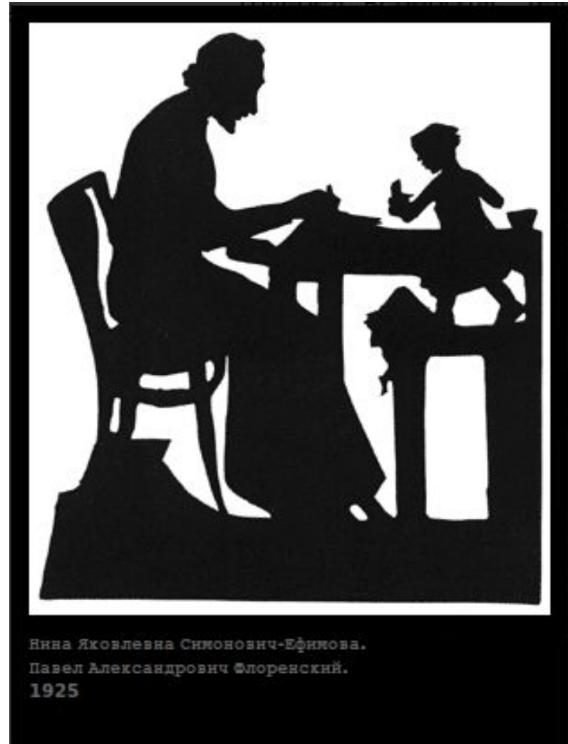
Янна Яковлевна Симонович-Ефимова. Павел Александрович Флоренский. 1925