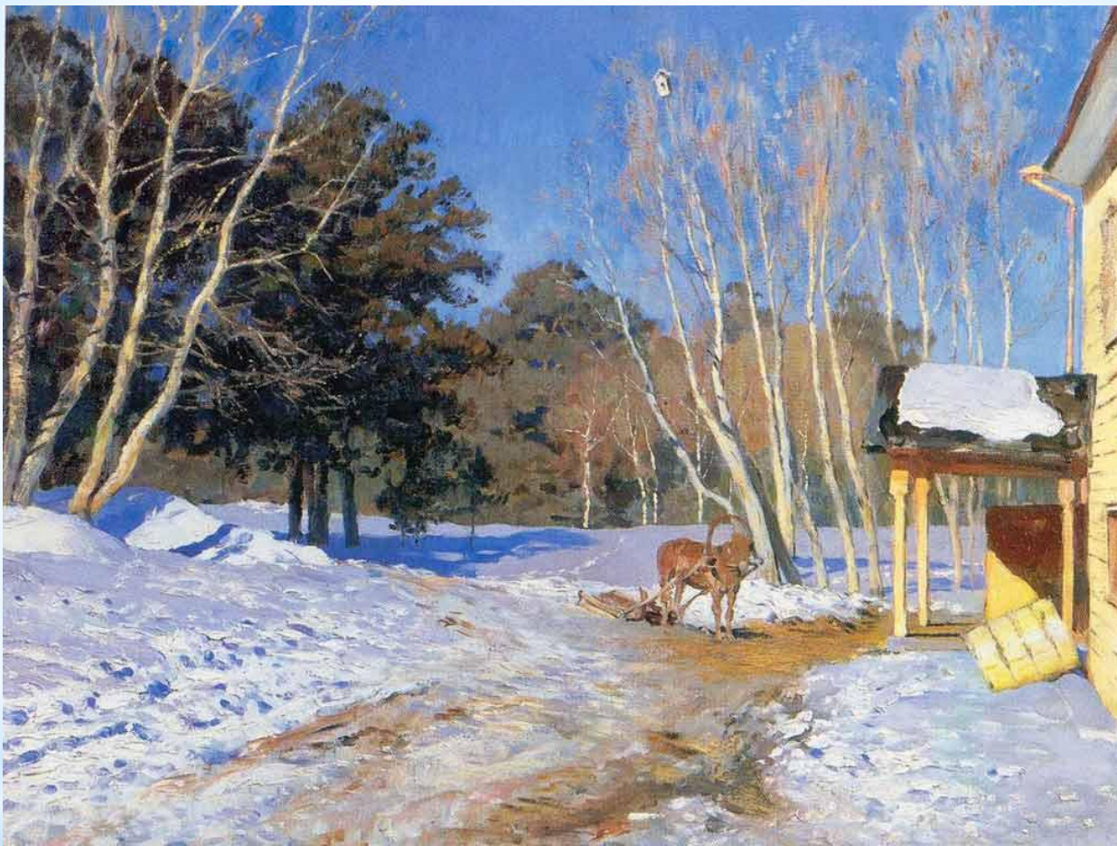
Исаак Левитан «Март»