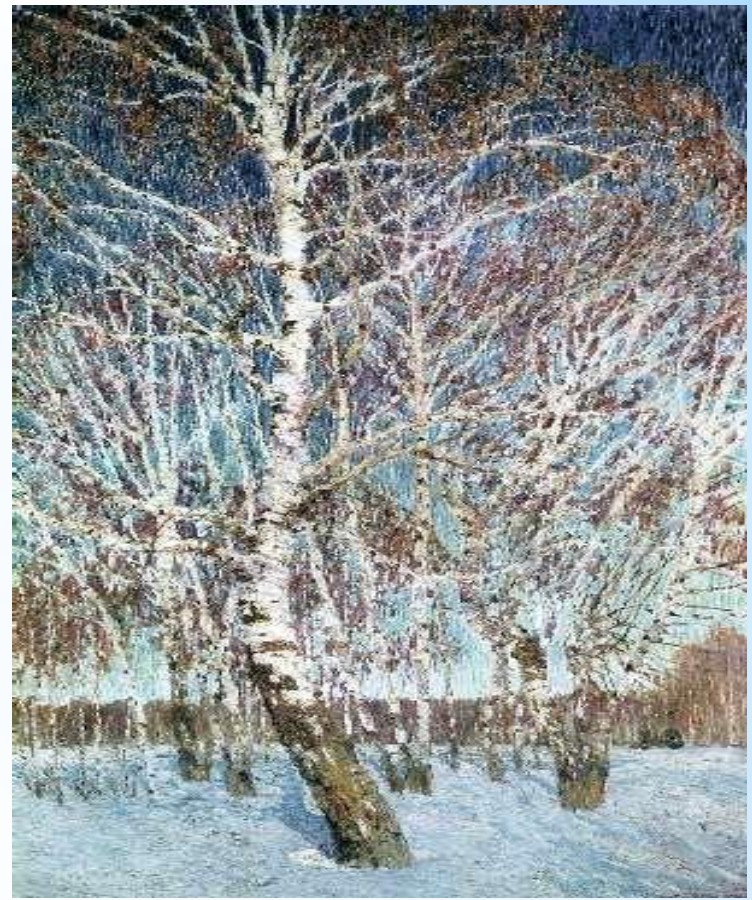
Исаак Левитан «Февральская лазурь»

Представители разных видов искусств едины в своём восприятии пейзажа прежде всего как отражения мира чувств и переживаний человека. Такое изображение природы принято называть пейзажем настроения.