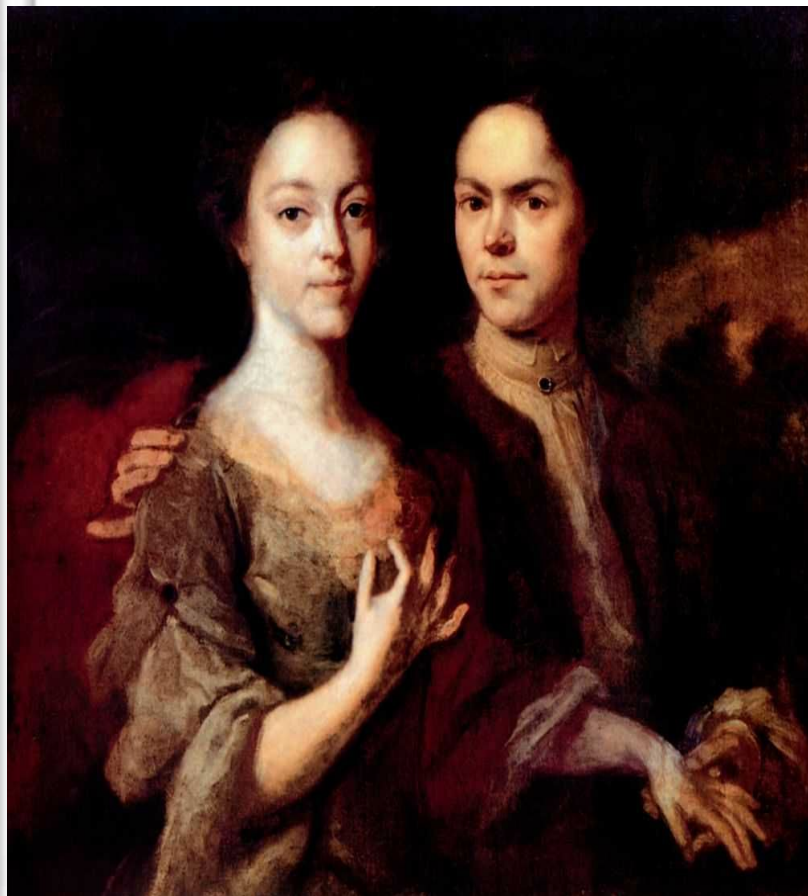
Портрет с женой.

Небывалым расцветом новых ремесел и искусств начавшимся в XVIII веке русская культура обязана в первую очередь Петру посылавшему талантливую молодежь учиться в Европу. Один из первых кого царь послал обучаться за границу мастерству живописца стал Андрей Матвеев. По существующей легенде юный Андрей повстречал царя в Софийском соборе Новгорода и тот предложил ему ехать учиться. Будущему живописцу было тогда что-то около пятнадцати лет, был ли он тогда учеником иконописца или с какой-то другой стороны имел отношение к живописи неизвестно. Так же неизвестно его настоящее отчество: Матвеевич или Меркурьевич, то же самое касается и фамилии, иногда Андрей Матвеев упоминается как Кобылин. По другим сведениям отец Андрея Матвеева был подъячим, служившим в при дворе в Петербурге и учиться Андрея послала Екатерина I. В любом случае то что Андрей Матвеев учился живописному мастерству в Голландии и Фландрии и был личным стипендиатом Екатерины I является