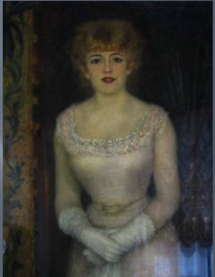
Портрет актрисы Жанны Самари (1878, Государственный Эрмитаж)