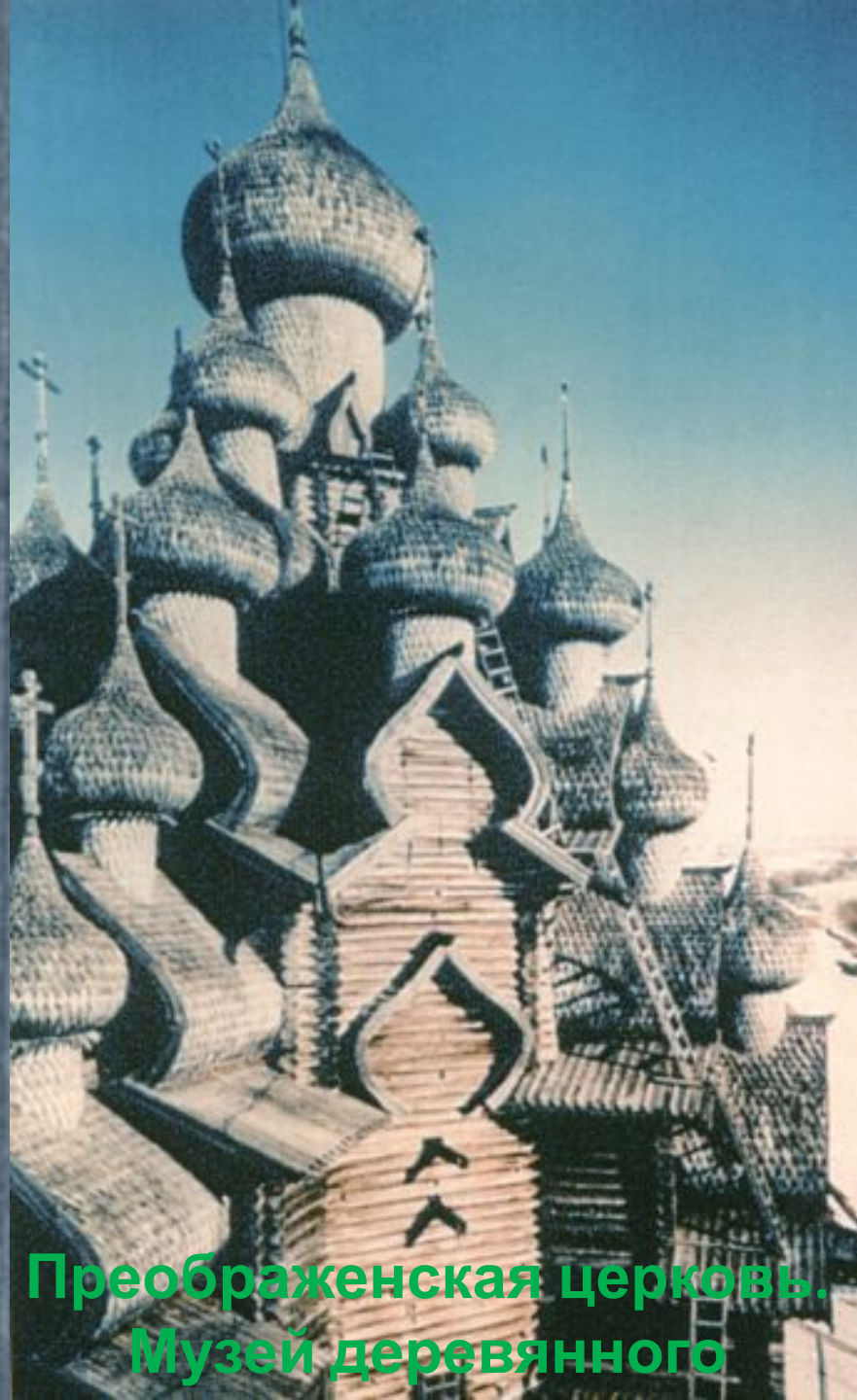
Преображенская церковь. Музей деревянного