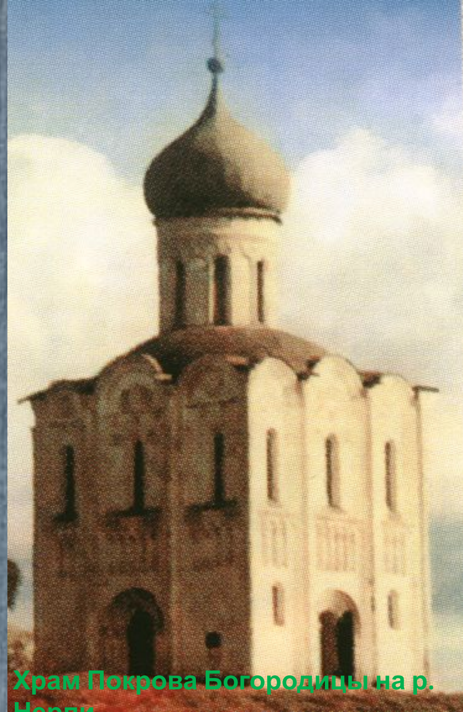
Храм Покрова Богородицы на р. Нерли