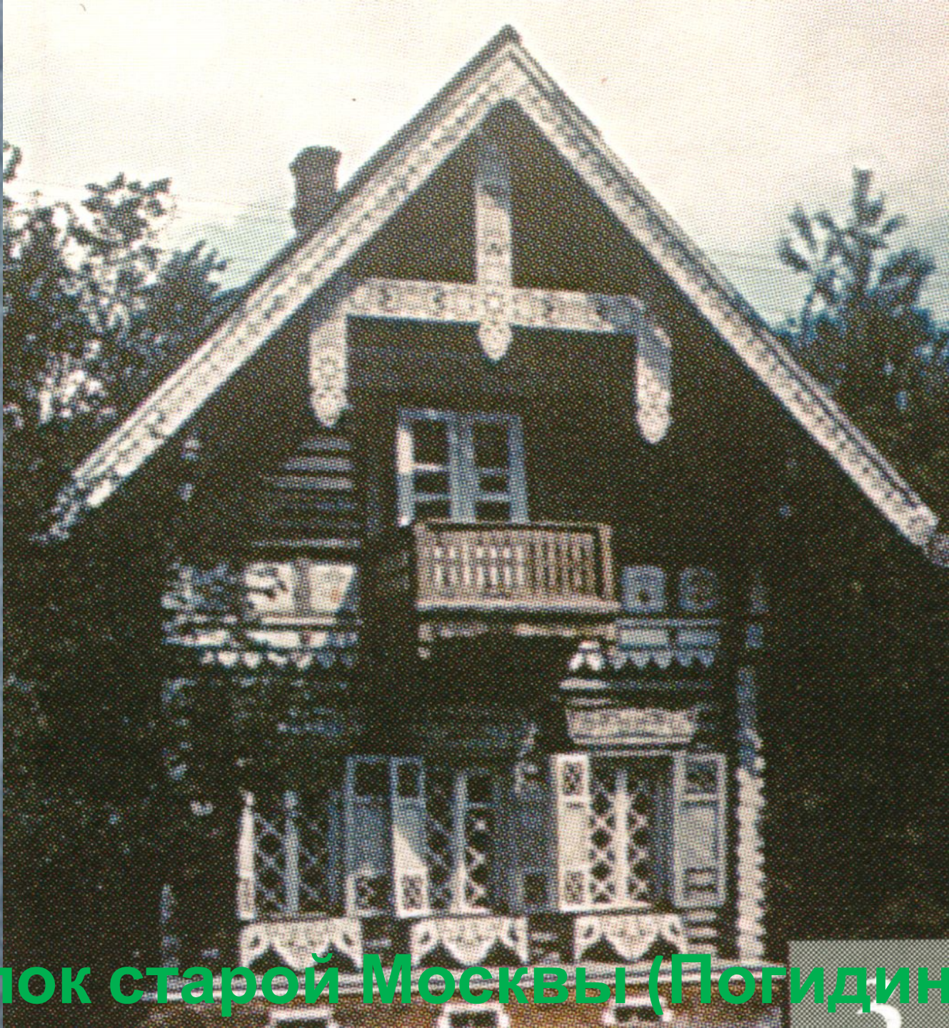
Уголок старой Москвы (Погидинская