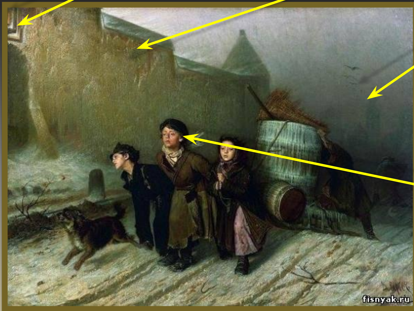
Василий Григорьевич Перов. «Тройка». Ученики мастеровые везут воду» 1866, ГТГ