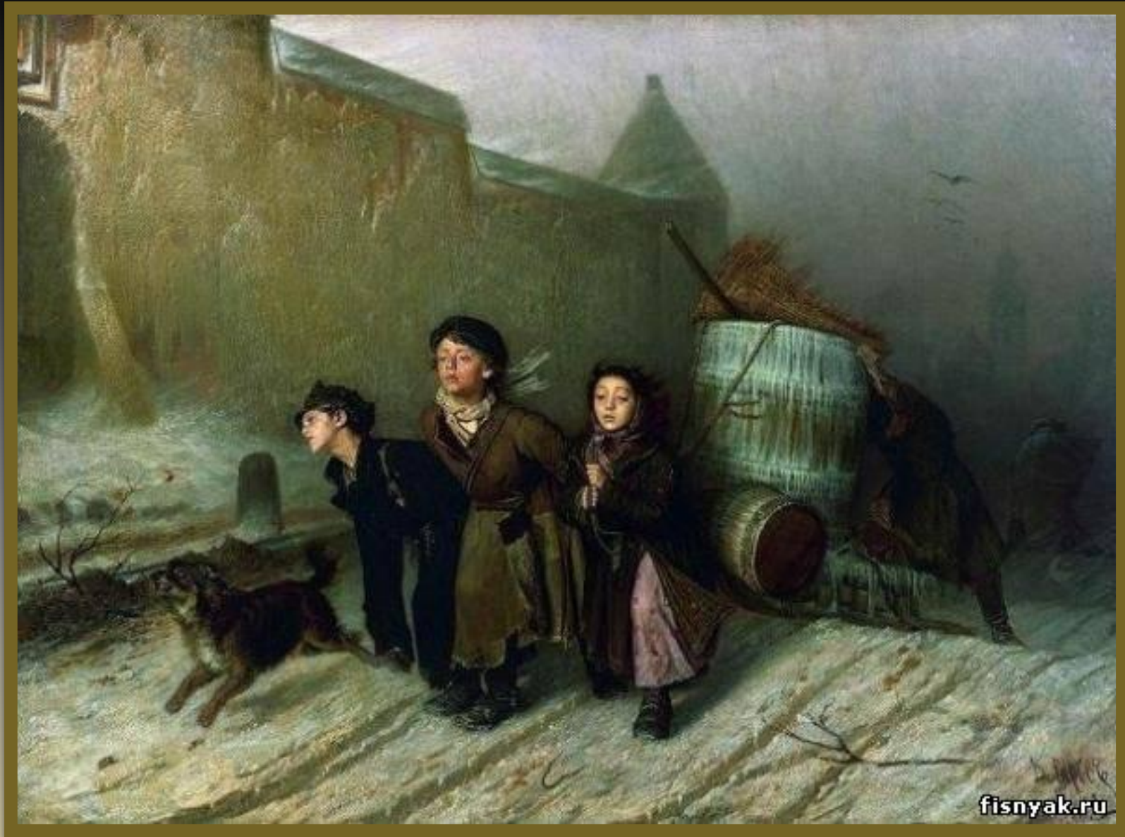
Василий Григорьевич Перов. «Тройка». Ученики мастеровые везут воду» 1866, ГТГ