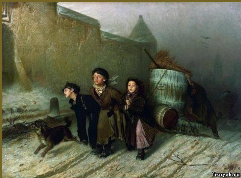
Василий Григорьевич Перов. «Тройка». Ученики мастеровые везут воду» 1866, ГТГ

В письме к Д. Григоровичу Перов так объяснил замысел этой хрестоматийной картины: «Четыре маленьких несчастных ученика (мастеровых), в страшный мороз и вьюгу везущие в гору огромную кадку воды, одетые не совсем по сезону».