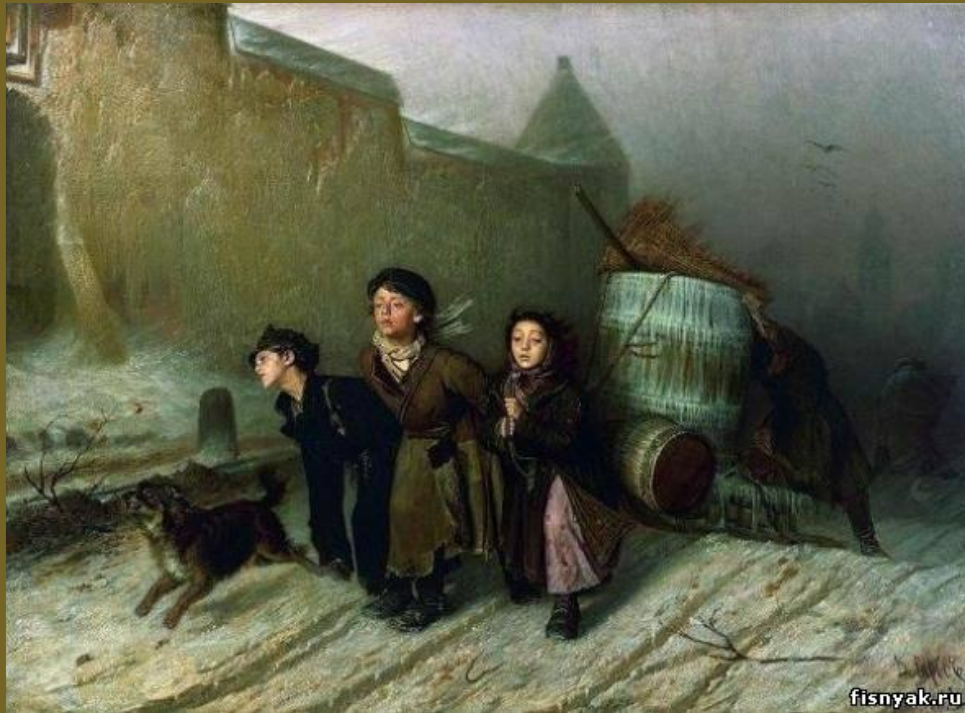
Василий Григорьевич Перов. «Тройка». Ученики мастеровые везут воду» 1866, ГТГ

Грустную историю, тесно связанную с этими поисками, Перов поведал в своём рассказе «Тётушка Марья». Он всё-таки однажды обнаружил нужного мальчика – тот шёл вместе с матерью молиться в храм.