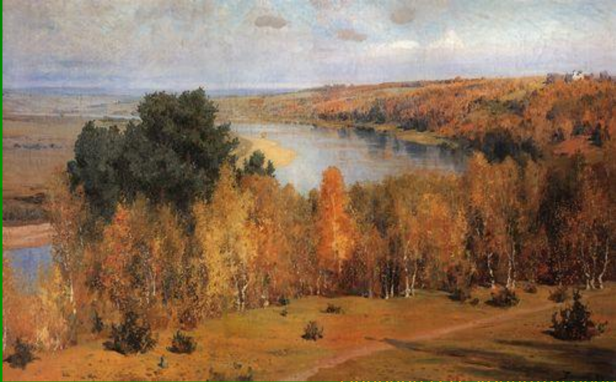
Шведов И.И. «Осенний день»

Опять осенний блеск денницы Дрожит обманчивым огнём, И уговор заводят птицы Умчаться стаей за теплом. И болью сладостно-суровой Так радо сердце вновь зануть, И в ночь краснеет лист кленовый, Что, жизнь любя, не в силах жить.