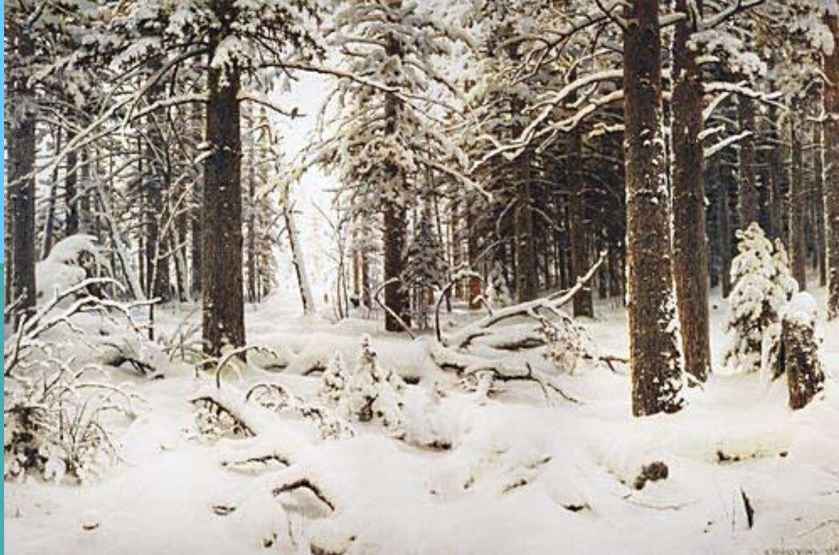
Шишкин И.И. «Зима»