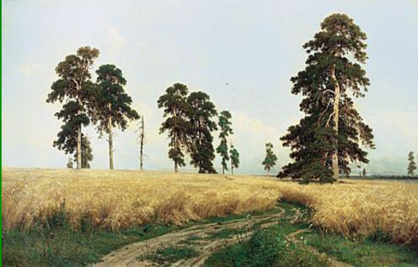
И.И. Шишкин «Рожь»

Зреет рожь над жаркой нивой, И от нивы и до нивы Гонит ветер прихотливый Золотые переливы.