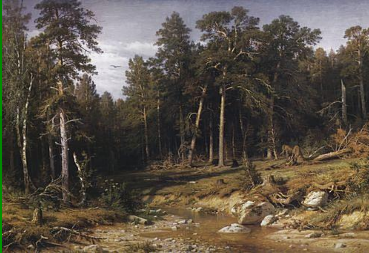
ШИШКИН И.И. «СОСНОВЫЙ БОР»