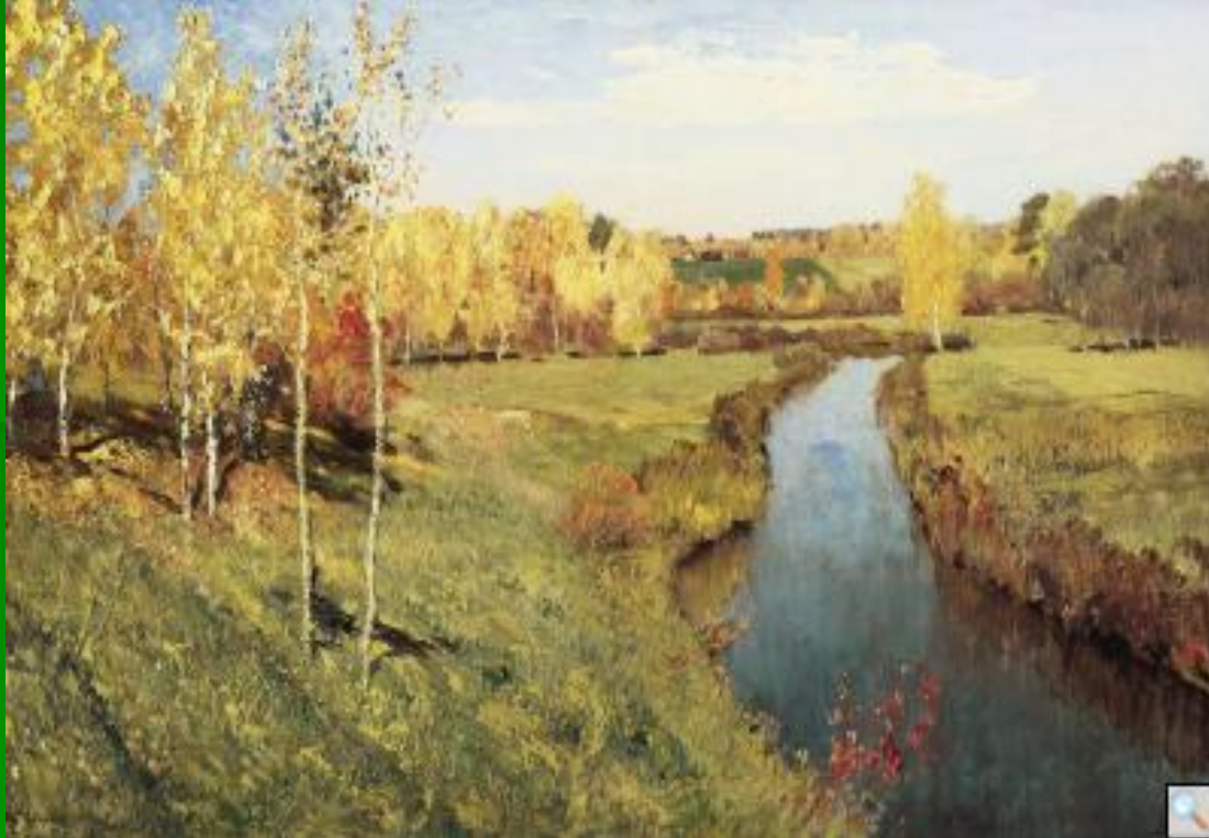
Левитан И.И. «Золотая осень»