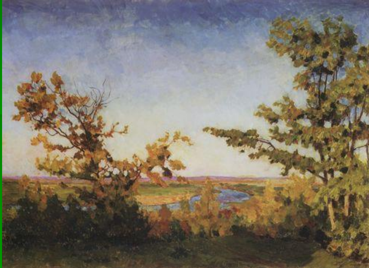
Грабарь И.Э. «Ясный осенний вечер»