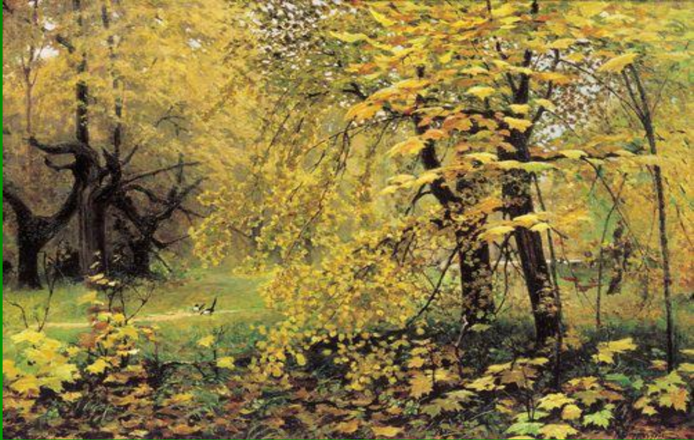
Остроухов И.С. «Золотая осень»