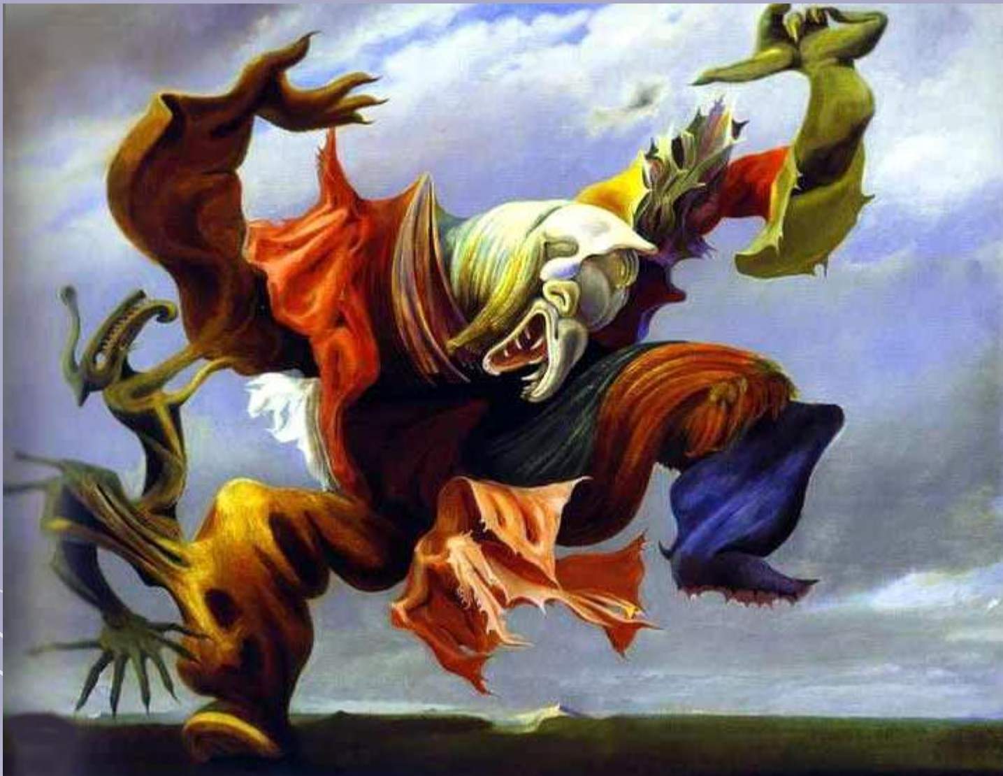
Ангел очага или триумф сюрреализма, 1937, Частное собрание