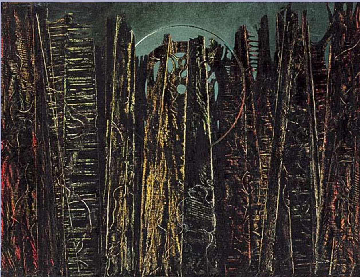
Лес и черное солнце, 1927–1928