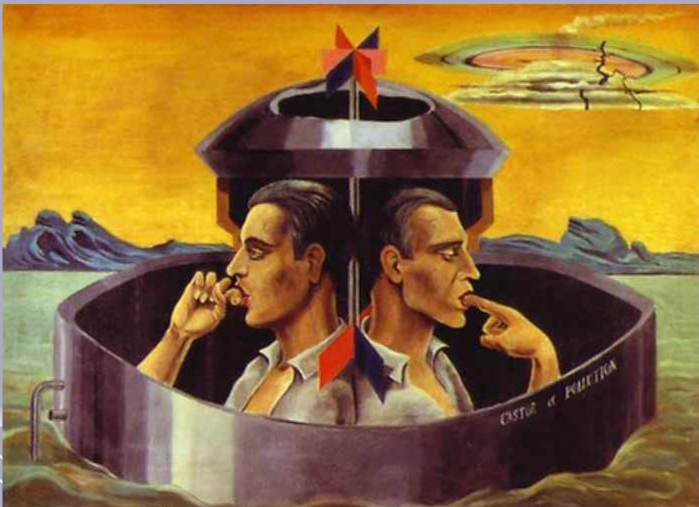
Кастор и Поллукс, 1923