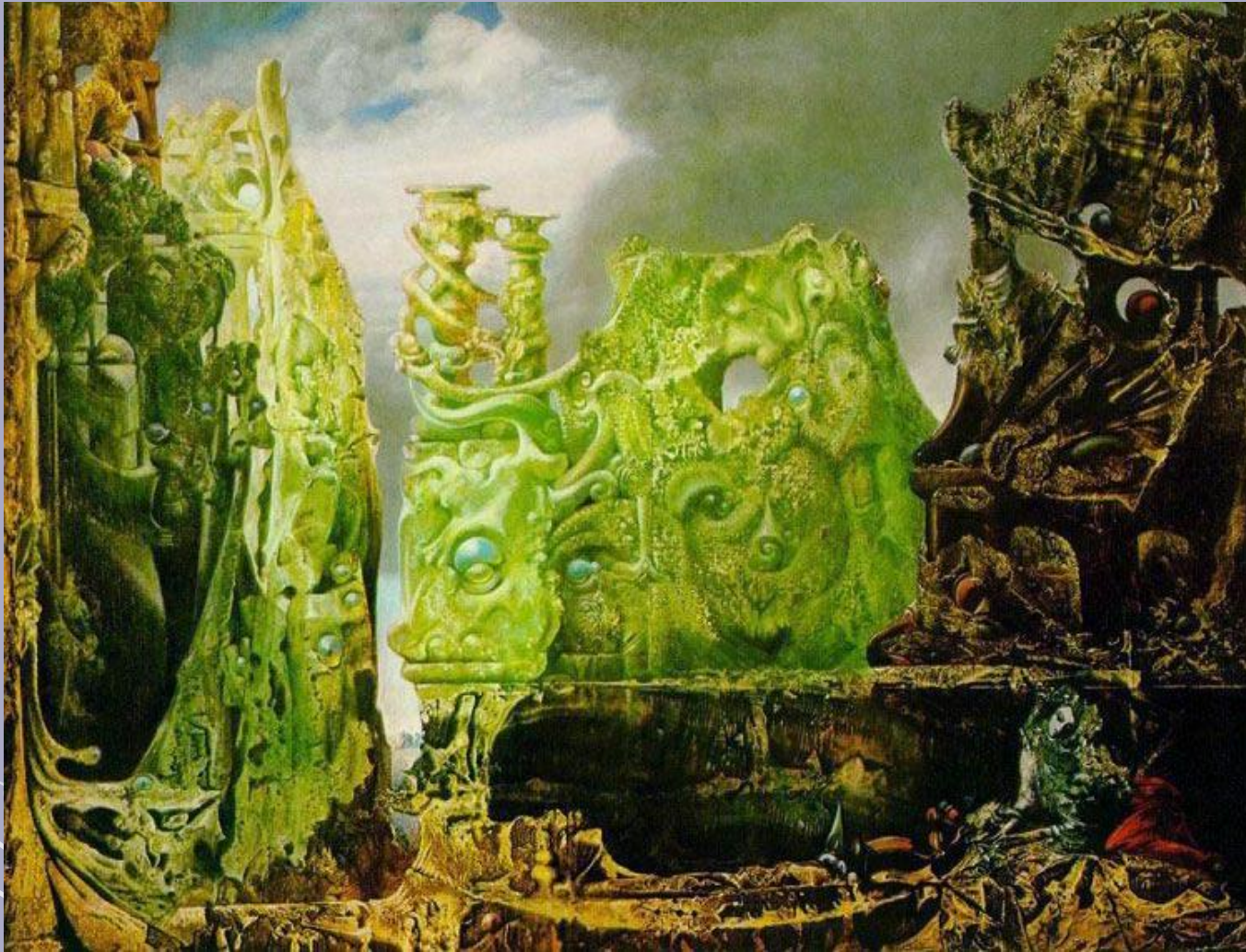
Око безмолвия, 1943-1944.