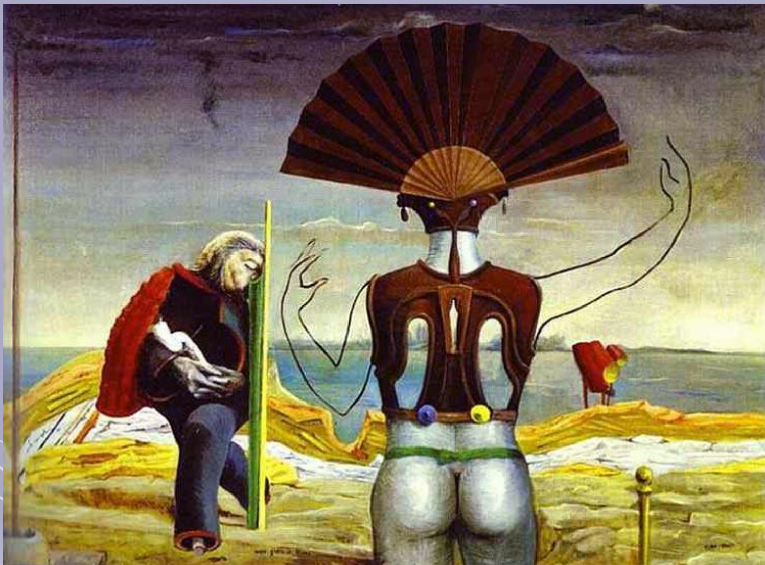
Женщина, старик и цветок, 1924