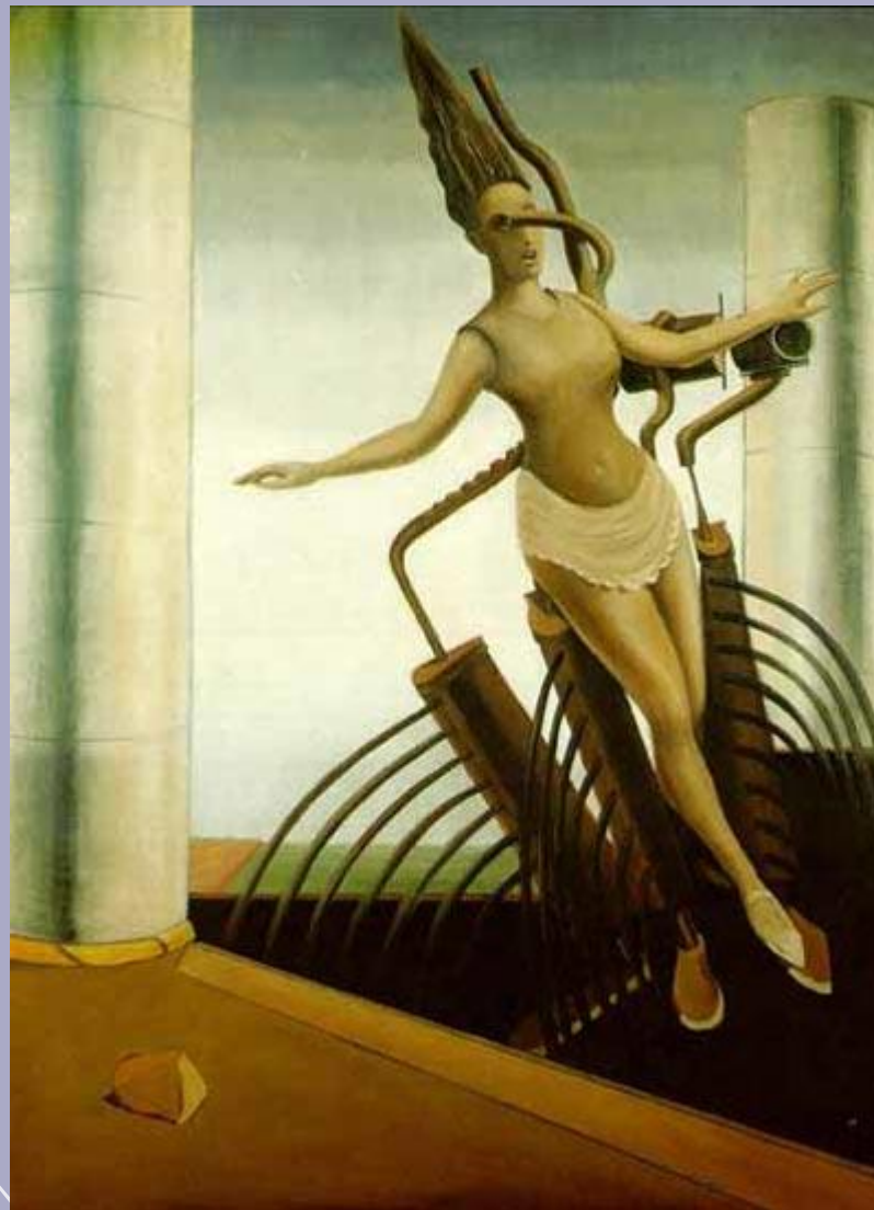
Сомнительная женщина, 1923