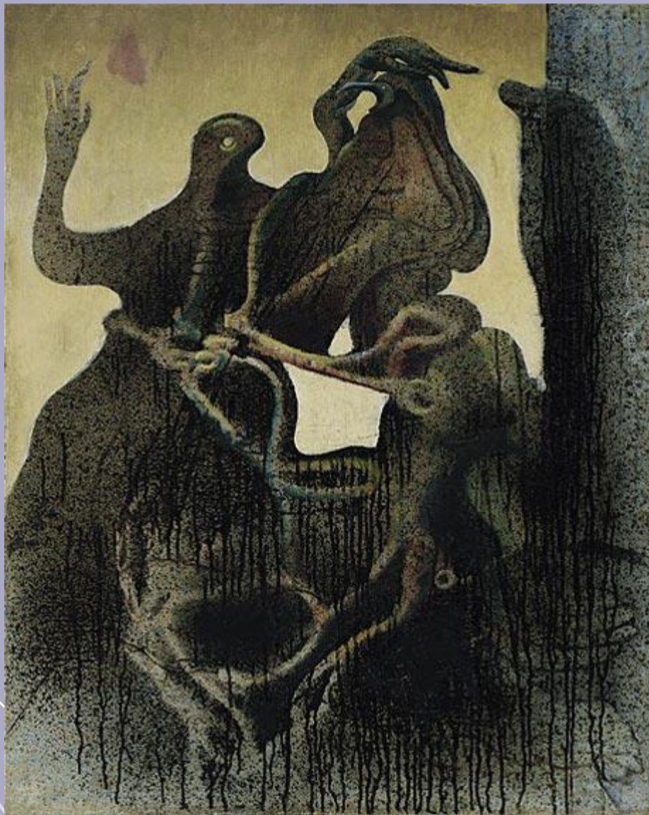
Зооморфическая пара, 1933