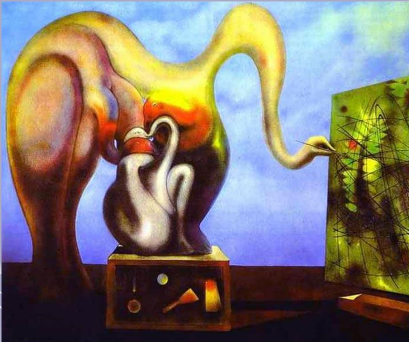
Сюрреализм и живопись, 1942