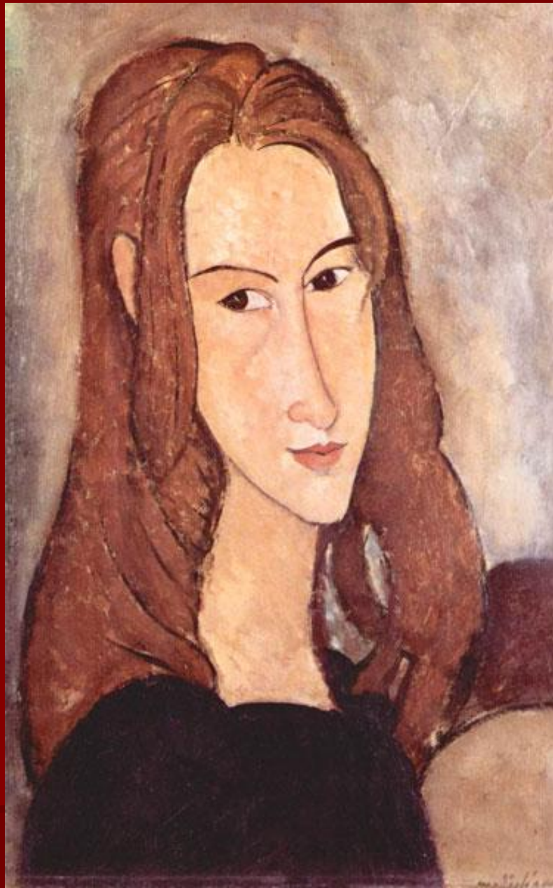
А. Модильяни. «Жоан Эбутерн».