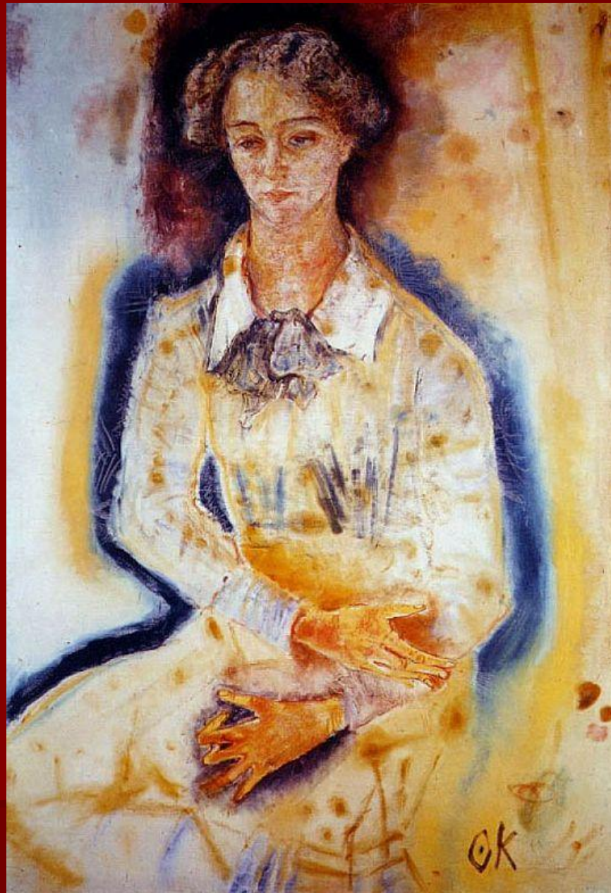
О. Кокошка. «Лота Франц».