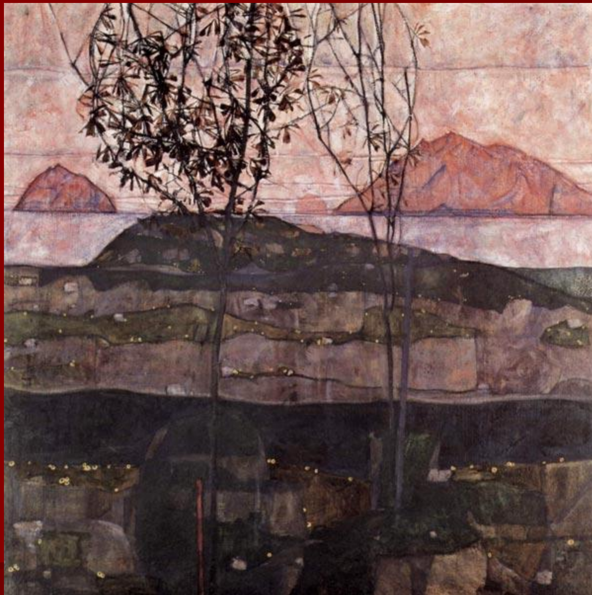
Э. Шиле. «Закат».