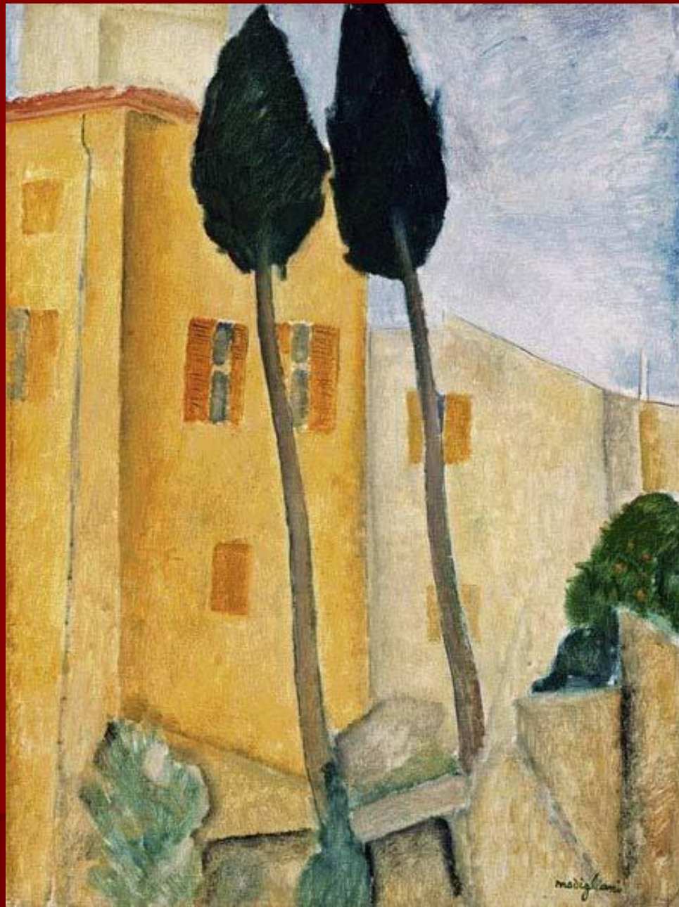
А. Модильяни. «Кипарисы и дома».