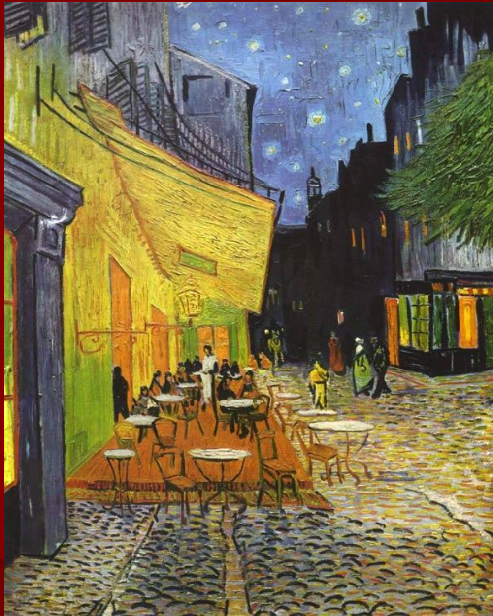
В. ван Гог. «Ночное кафе».