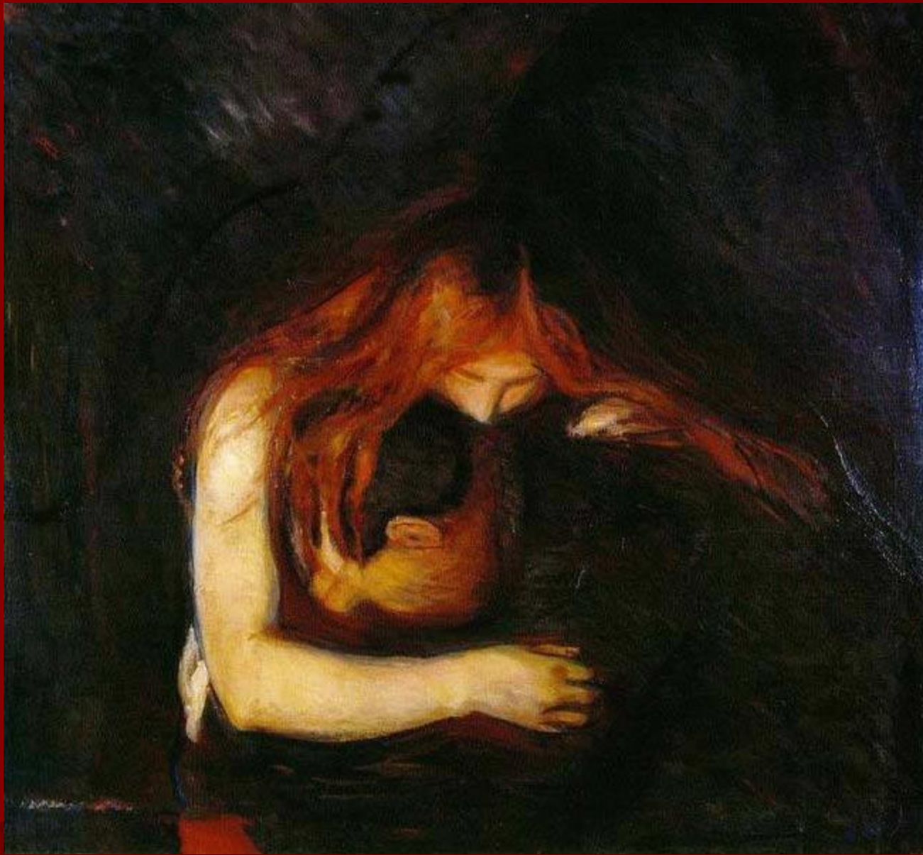
Э. Мунк. «Вампир».