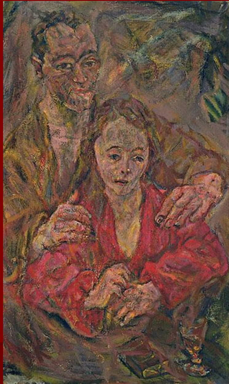
О. Кокошка. «Двойной портрет».