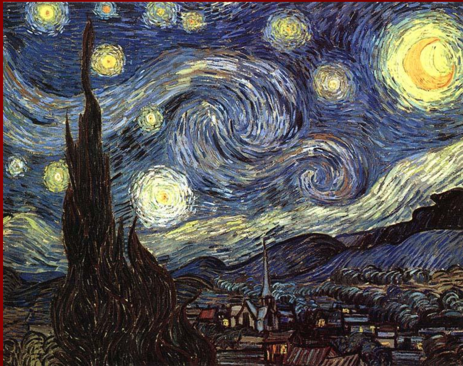
В. ван Гог. «Звёздная ночь».