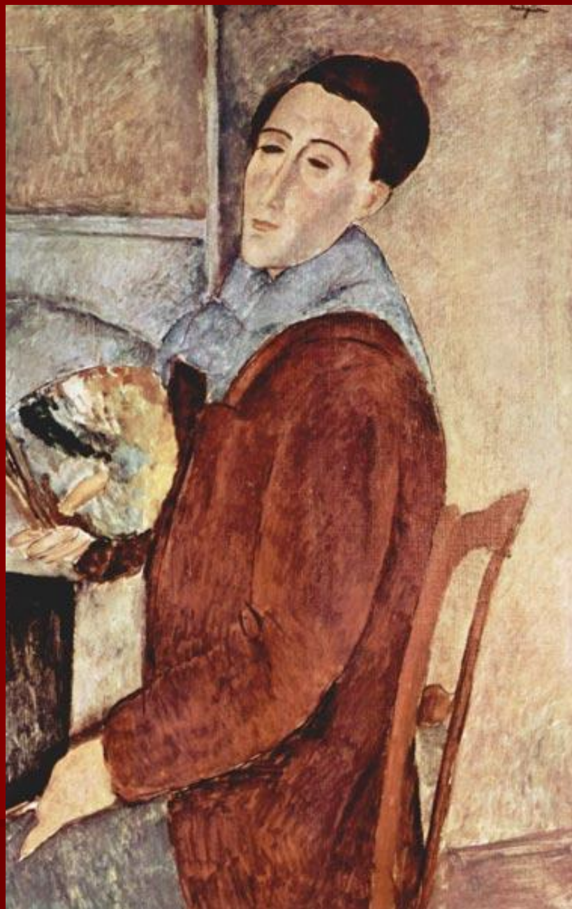
А. Модильяни. «Автопортрет».