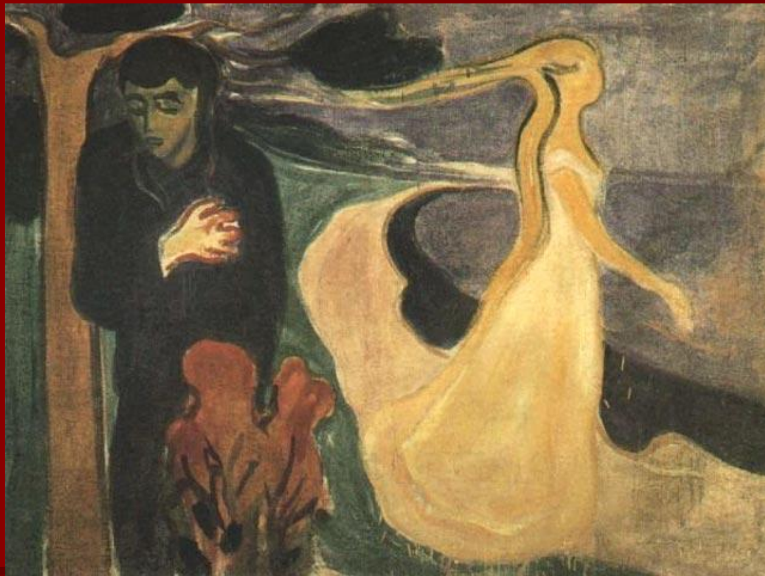
Э. Мунк. «Расставание».