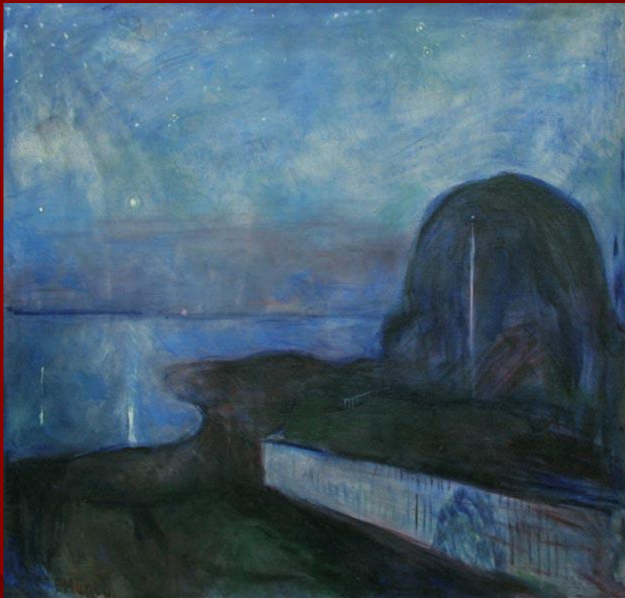
Э. Мунк. «Звёздная ночь».