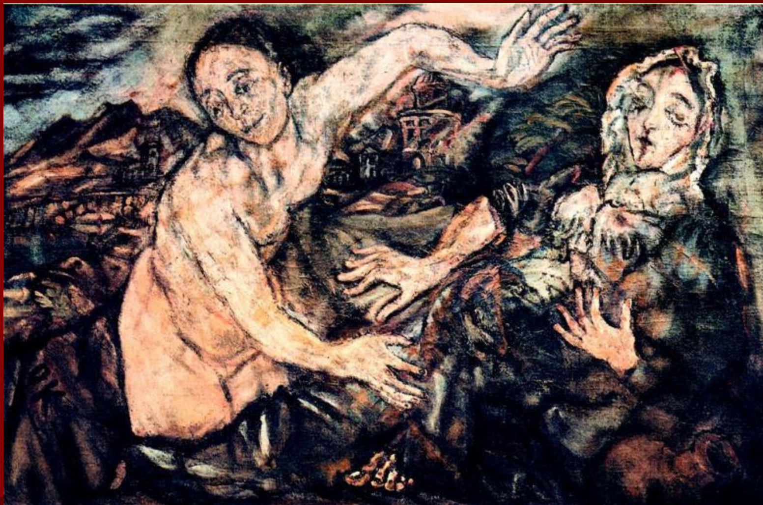
О. Кокошка. «Посвящение».