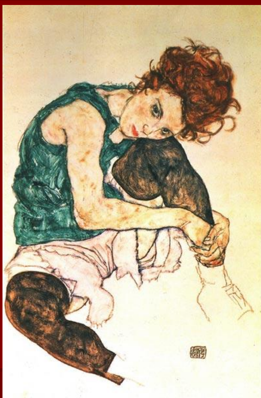
Э. Шиле. «Сидящая женщина».