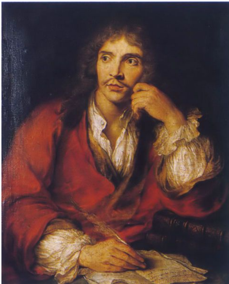
Жан Батист Мольер (Поклен) (1622 – 1673)