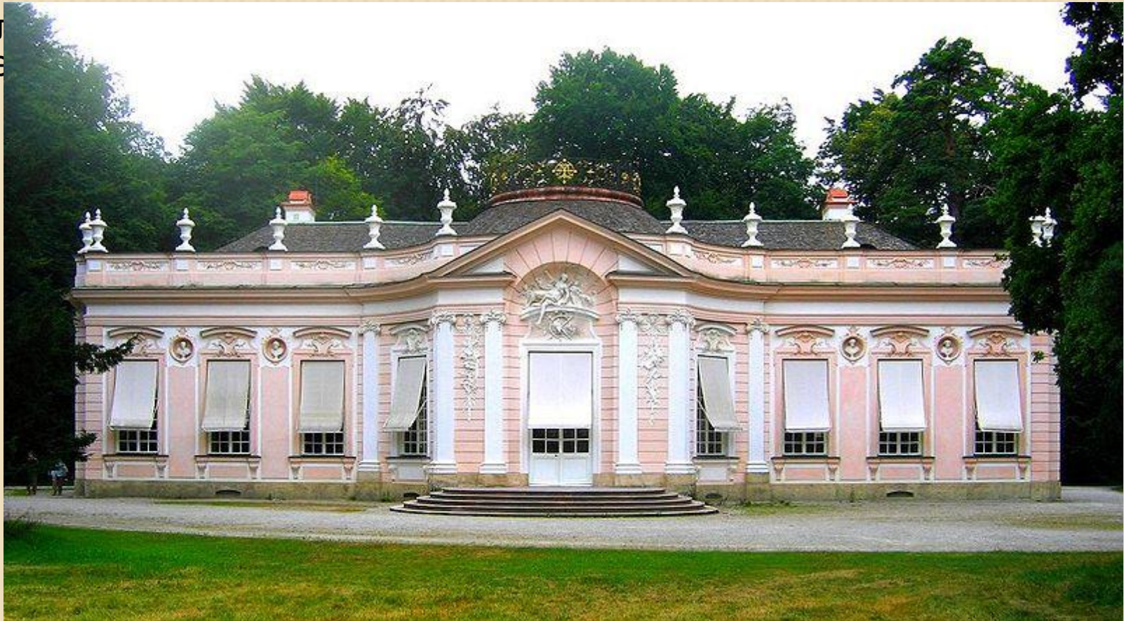
Французское рококо: Амалиенбург под Мюнхеном.