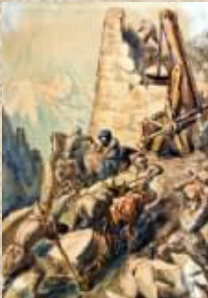
Махарбек Туганов. Иллюстрация к поэме К.Хетагурова 'Плачущая скала'