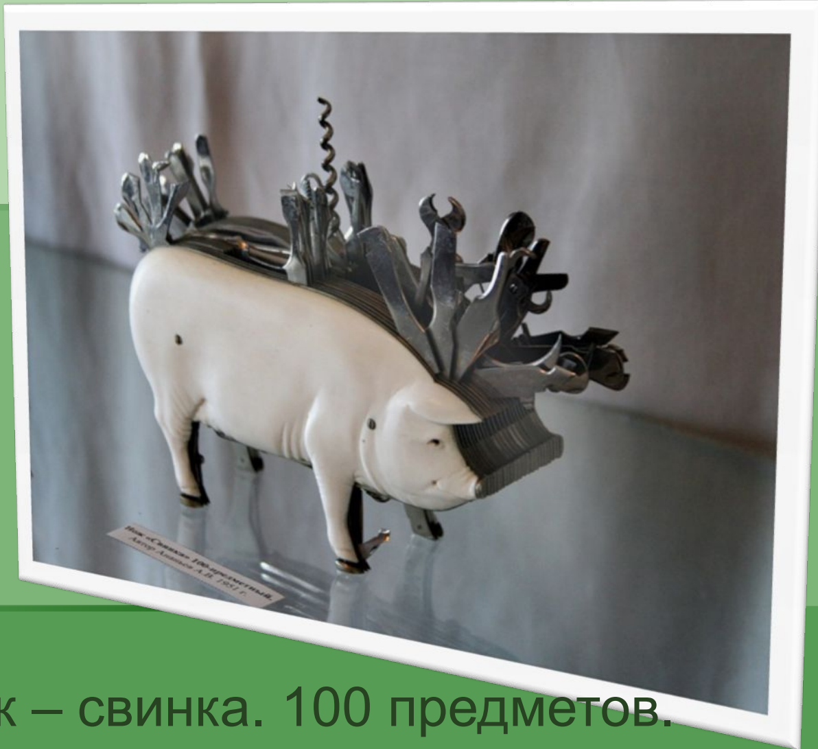
Нож – свинка. 100 предметов.