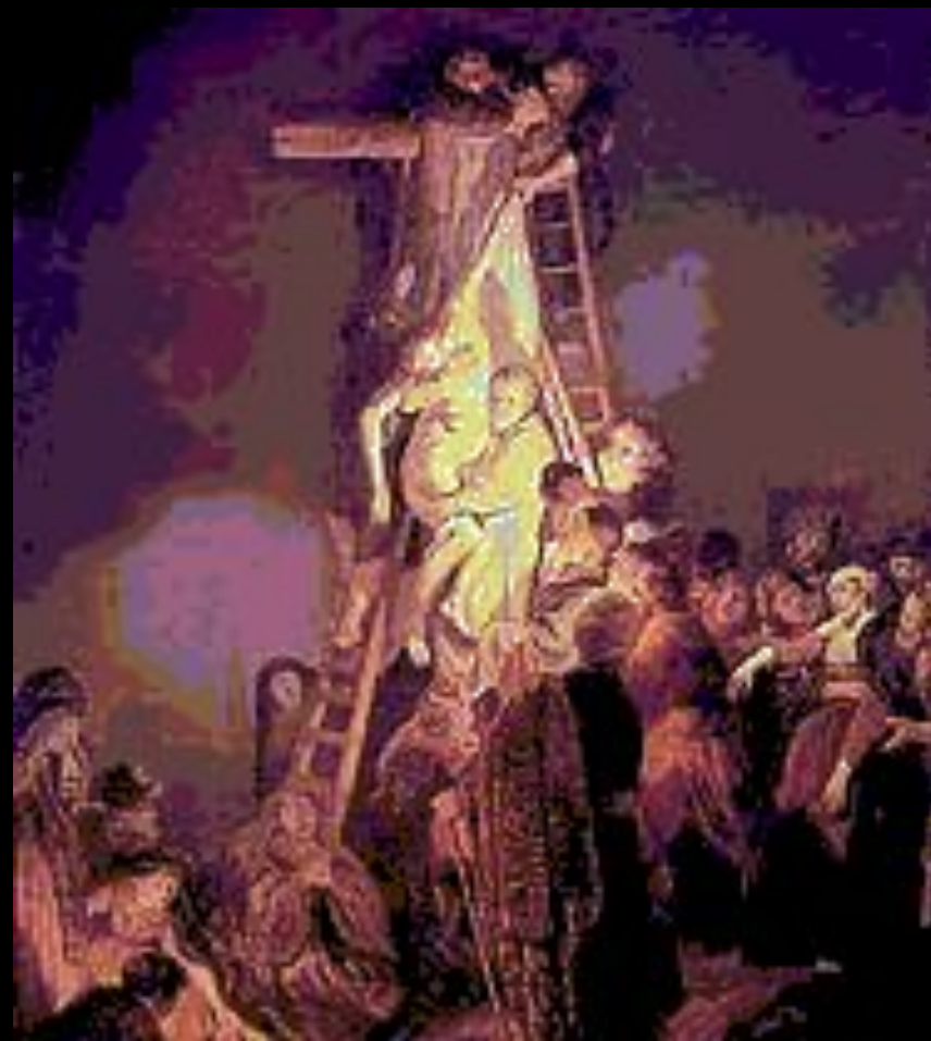
Снятие с креста