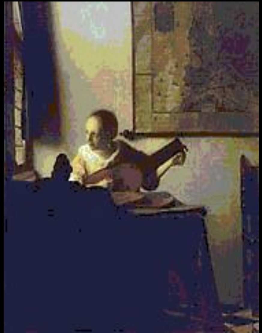
Дама с лютней