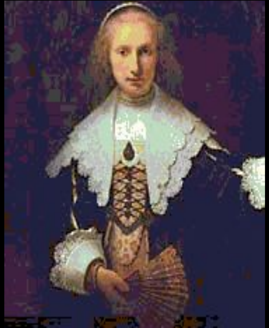
Портрет Агаты Бас