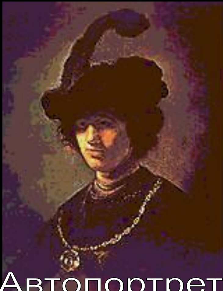
Автопортрет в молодости