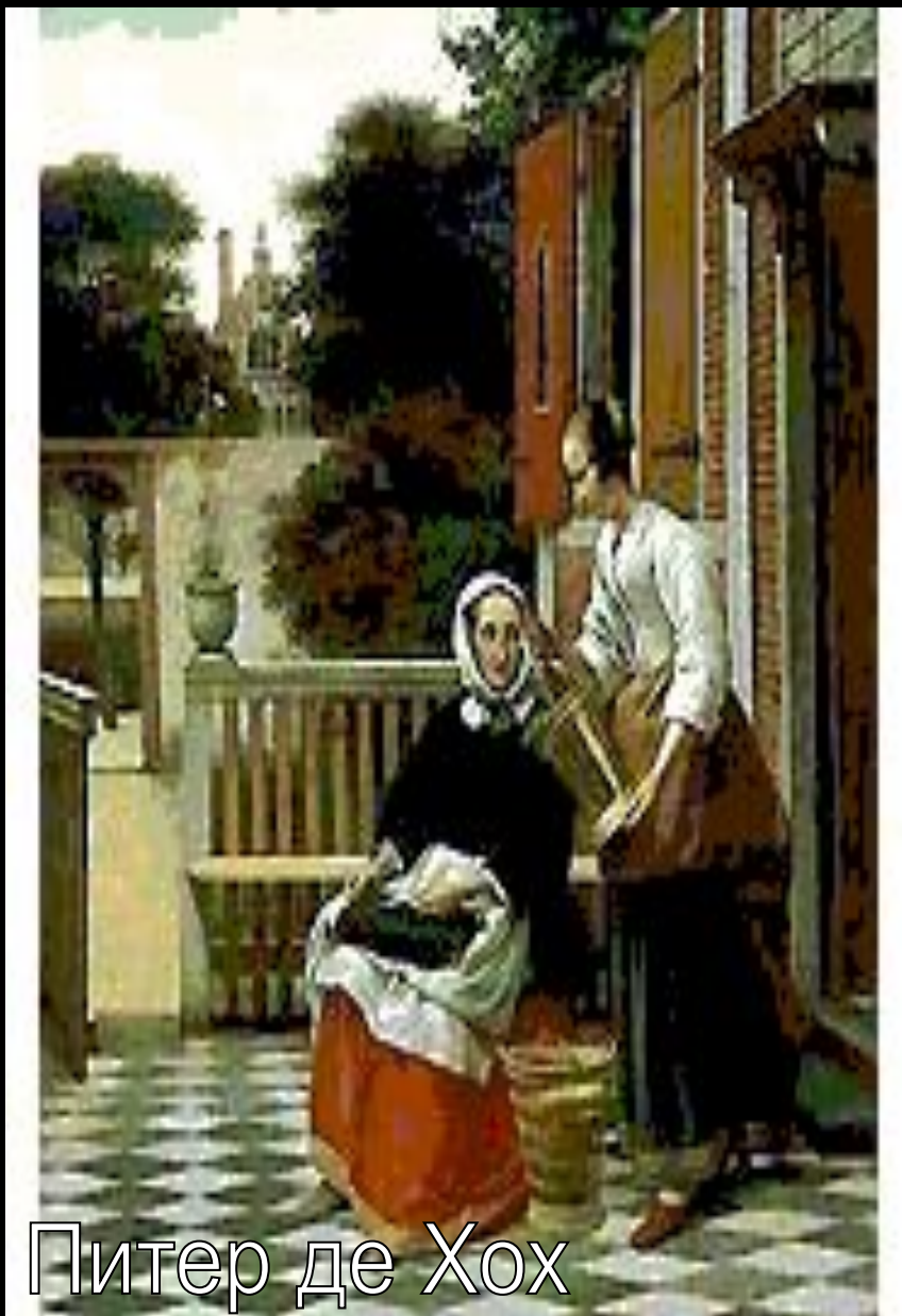
Питер де Хох