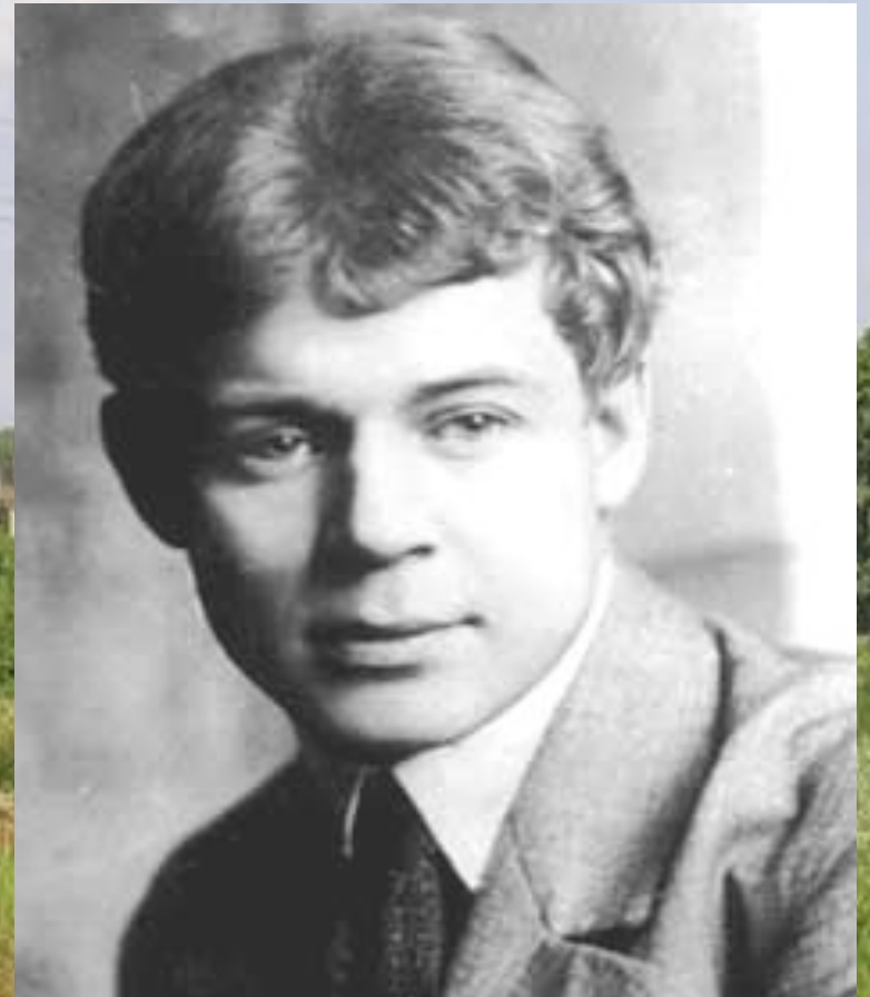
Есенин Сергей Александрович