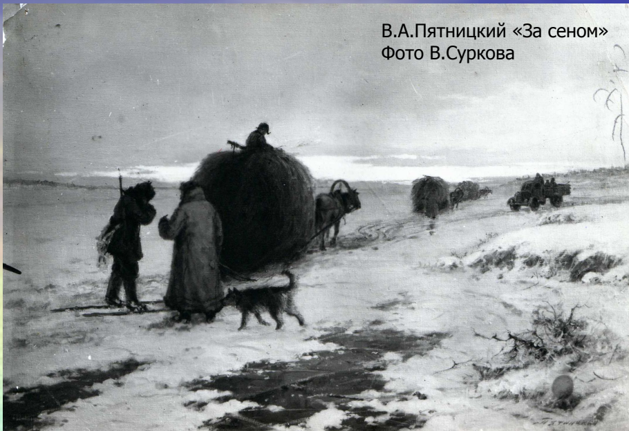
В.А.Пятницкий «За сеном»