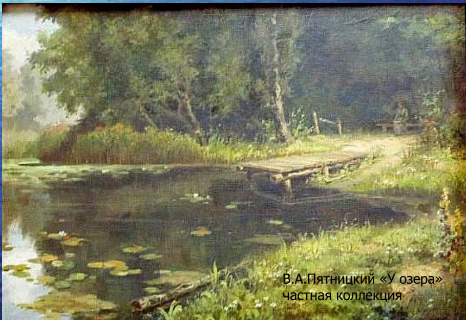
В.А.Пятницкий «У озера» частная коллекция