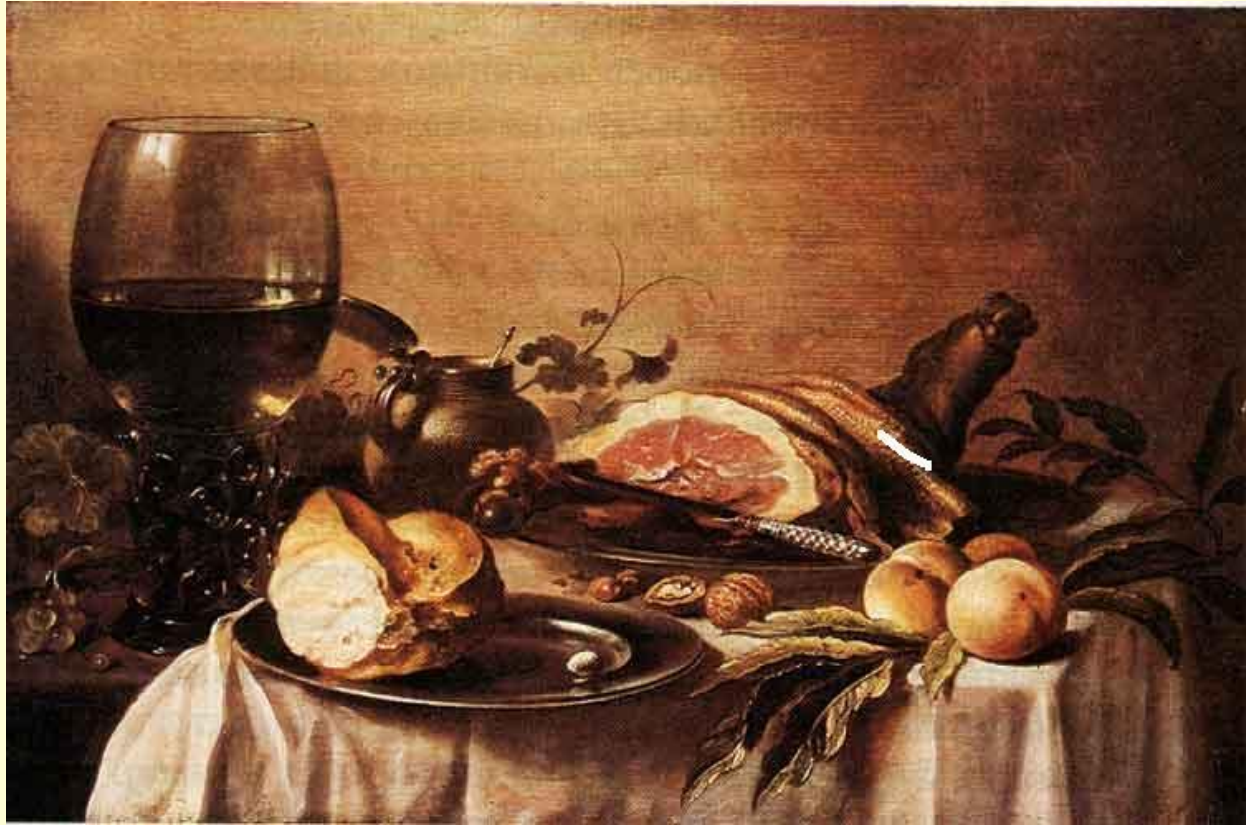
Питер Класс (Голландия). Завтрак с ветчиной.