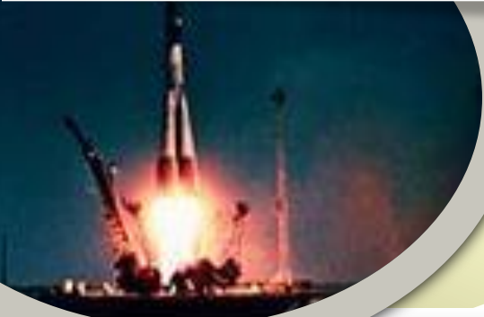
Космический корабль «Восток»

12 апреля 1961 года впервые в истории человечества Юрий Гагарин совершил полет в космос на космическом корабле «Восток». Гагарин облетел земной шар за один час 48 минут и благополучно вернулся на Землю.