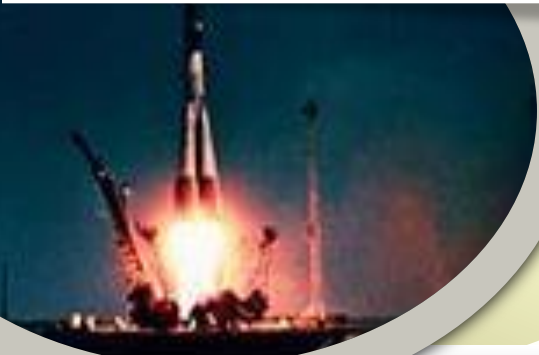
Космический корабль «Восток»

12 апреля 1961 года впервые в истории человечества Юрий Гагарин совершил полет в космос на космическом корабле «Восток». Гагарин облетел земной шар за один час 48 минут и благополучно вернулся на Землю.