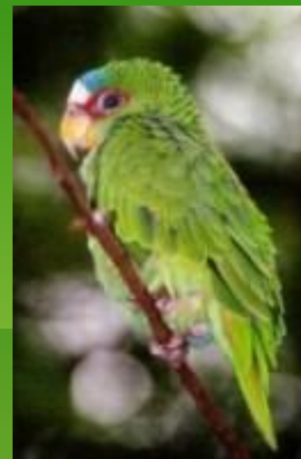
■ Белолобый амазон