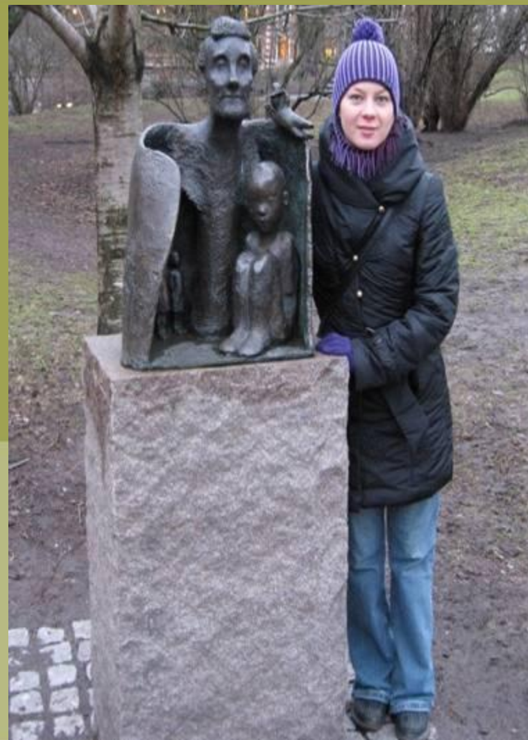
Женщина, которой при жизни был поставлен памятник