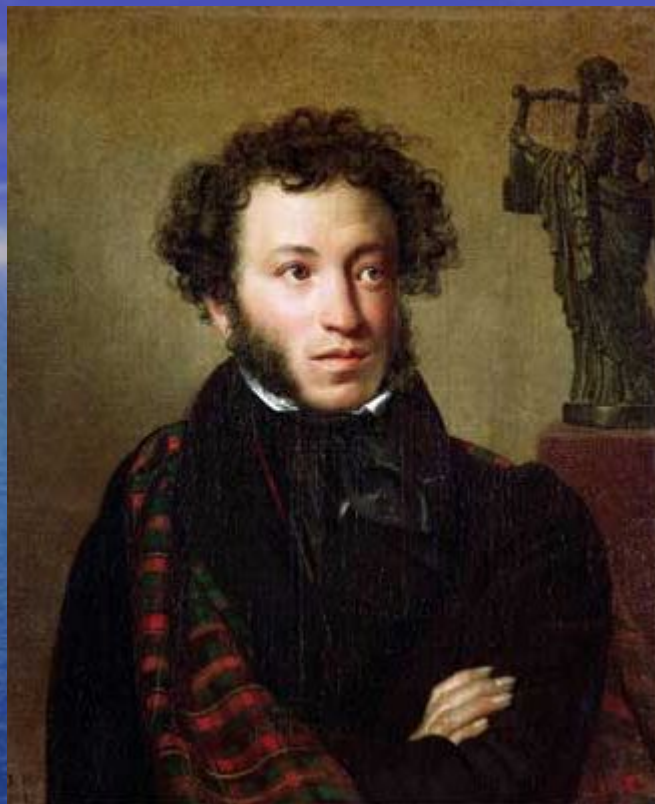
Александр Сергеевич Пушкин (1799 - 1837)