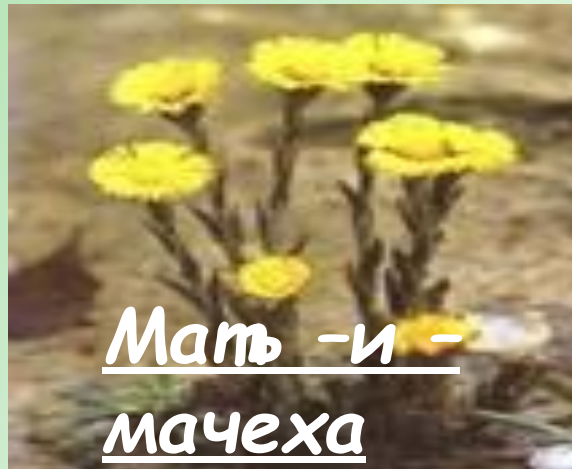
Мать -и - мачеха