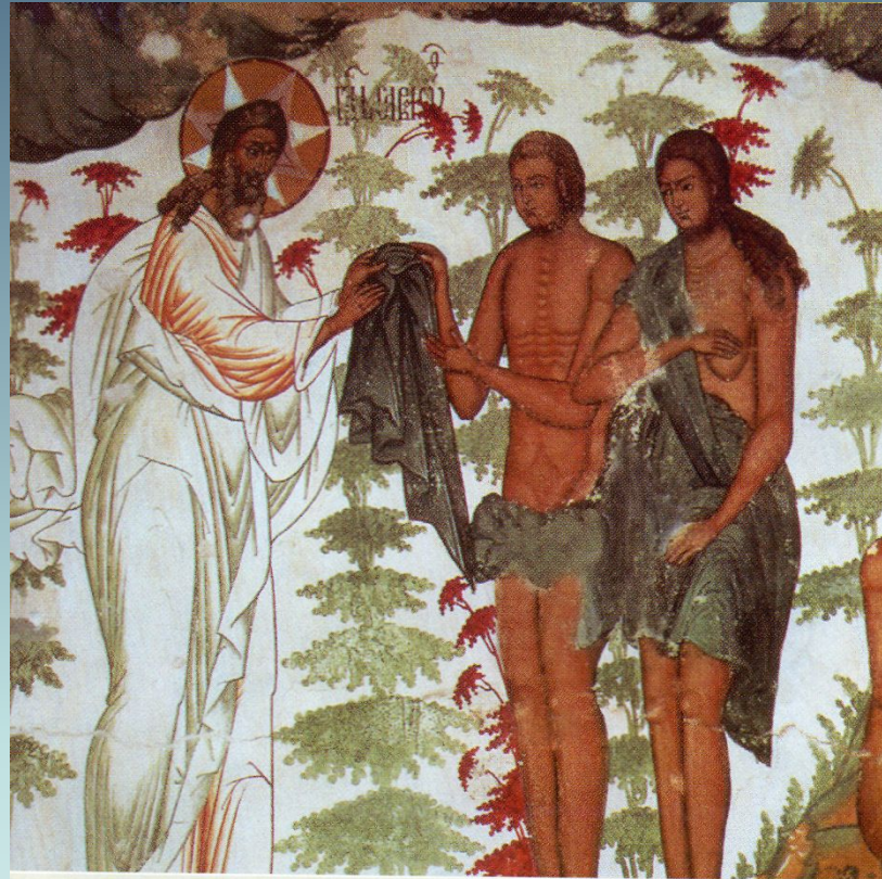
Адам и Ева. Деталь фрески Воскресения Христова Воскресенского собора. Город Романов-Борисоглебск (Тутаев)

Хорошо было Адаму и Еве жить в раю. Между всеми райскими деревьями были два особенно замечательные.