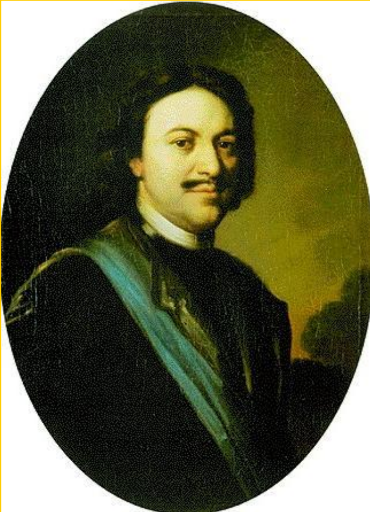
К.де Моор. Петр I.

В к.ХVII-н.ХVIII вв.во главе русского государства стоял самый выдающийся представитель династии Романовых Петр I.