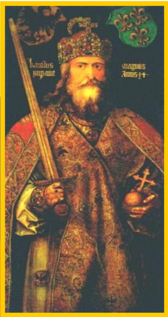
А.Дюрер. Карл Великий.

В к. V в. у франков возникло государство. В н. IX в. правителем государства франков стал Карл, прозванный Великим.