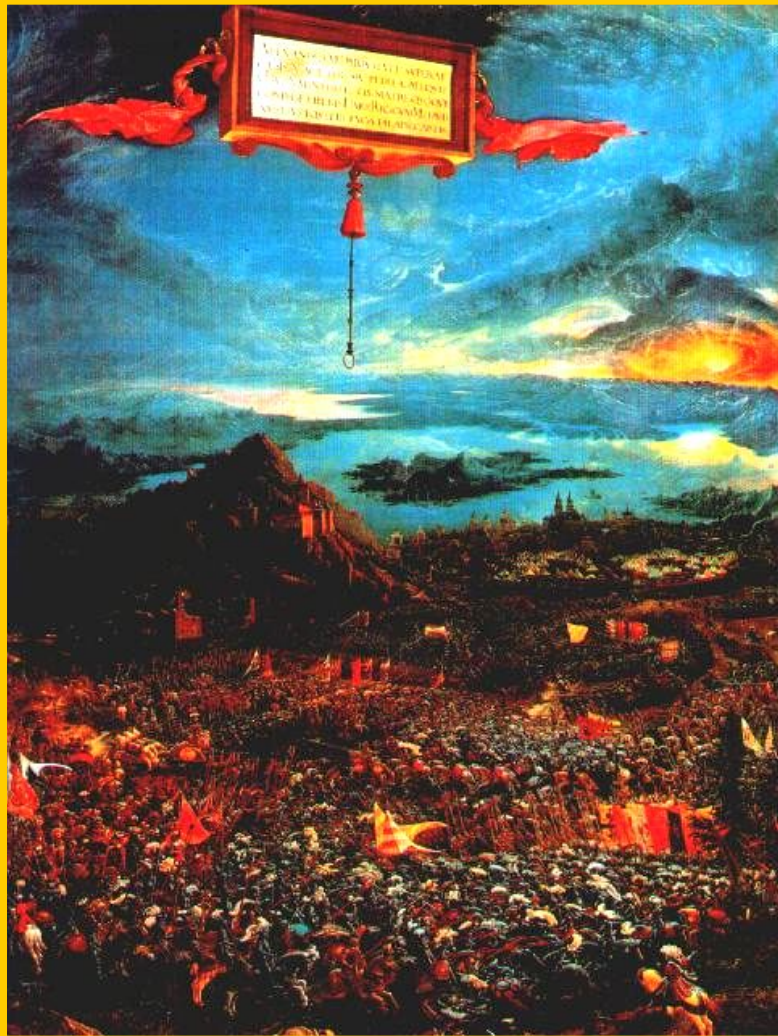
А.Альтдорфер. Битва Александра Македонского с Дарием.

У многих исторических деятелей были прозвища связанные с какими-то заслугами, событиями, личными качествами, или названием местности.