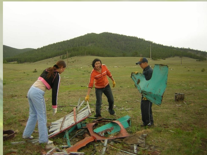
Экологическая акция «Чистое село»