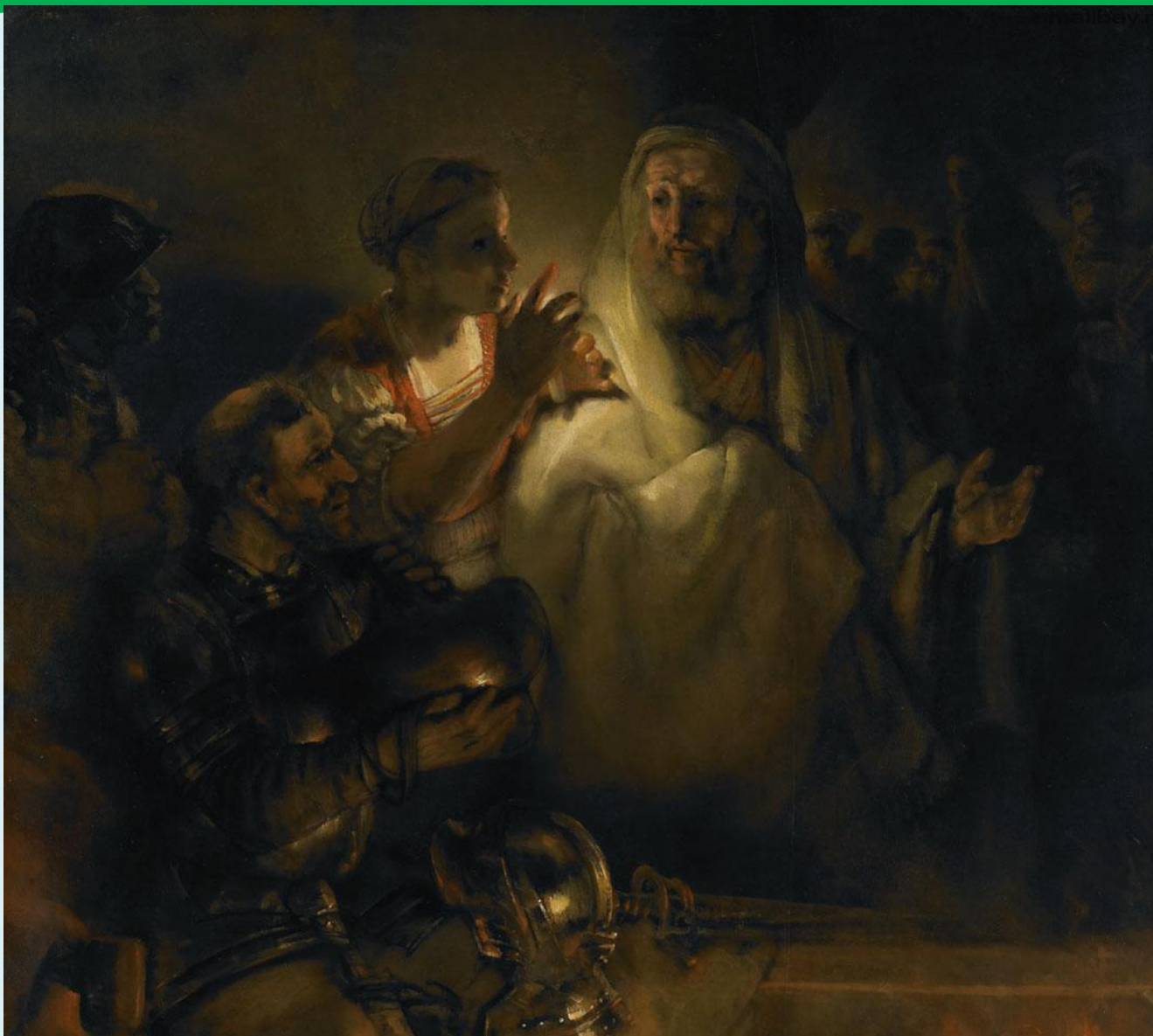
картина Рембрандта «Отречение Петра»