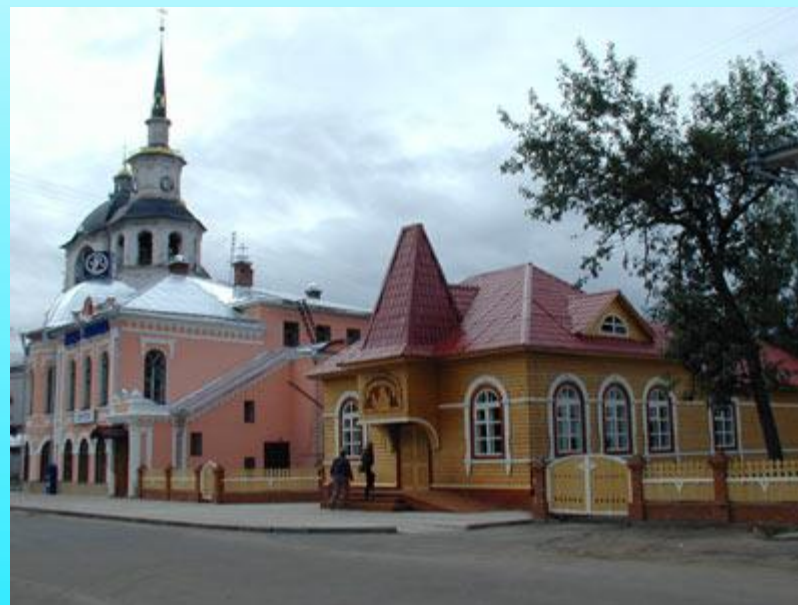
Почта Деда Мороза