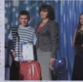
«Почта России» | Октябрь 2007