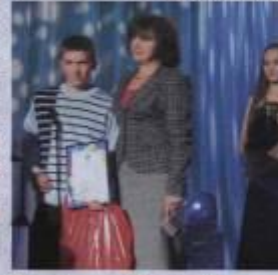
«Почта России» | Октябрь, 2007