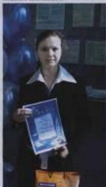
«Почта России» | Октябрь 2007

В 1969г., в 2007г. проводилась в 30-й раз. Для конкурса 2007г. была выбрана следующая тема: «Приветствие себе, что ты даже животное и что ты человек в прошлом, условиях и качествах твой среди обитателей планеты Земля». Награда писателям вручалась в Москве.