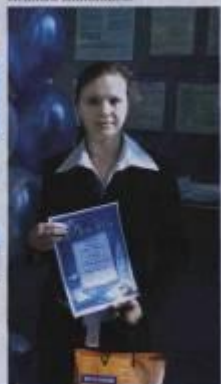
«Почта России» | Октябрь, 2007

В 1969г., в 2007г. проводилась в 30-й раз. Для конкурса 2007г. была выбрана следующая тема: «Приветствие себе, что ты даже животное и что ты человек в прошлом, условиях и качествах твой среди обитателей планеты Земля». Награда писателям вручалась в Москве.