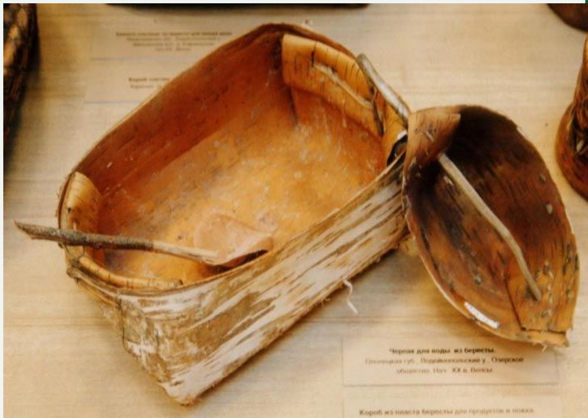
Черепок для воды из бересты. Синьковский губ. Издрывинский у. Озерской области. Нач. XX в. Белая.