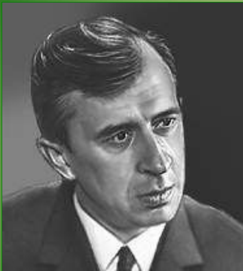
Анатолий Владимирович Жигулин (1930 – 2000)