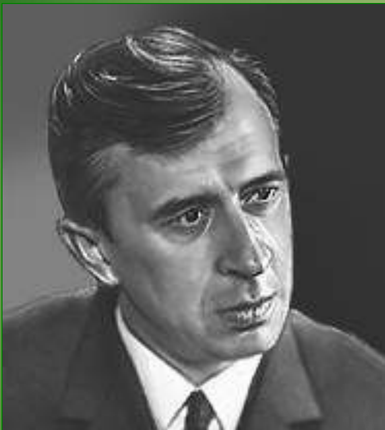
Анатолий Владимирович Жигулин (1930 – 2000)