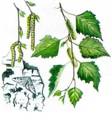
Береза - 24%