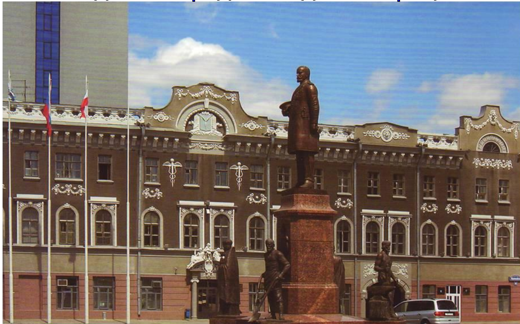
Памятник П.А. Столыпину