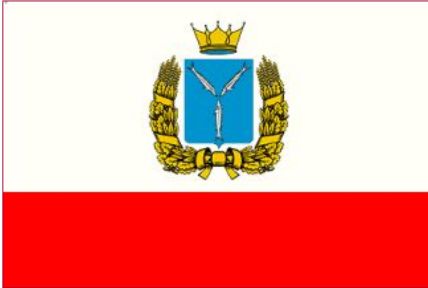
Флаг Саратовской области