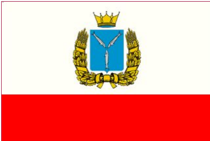
Флаг Саратовской области