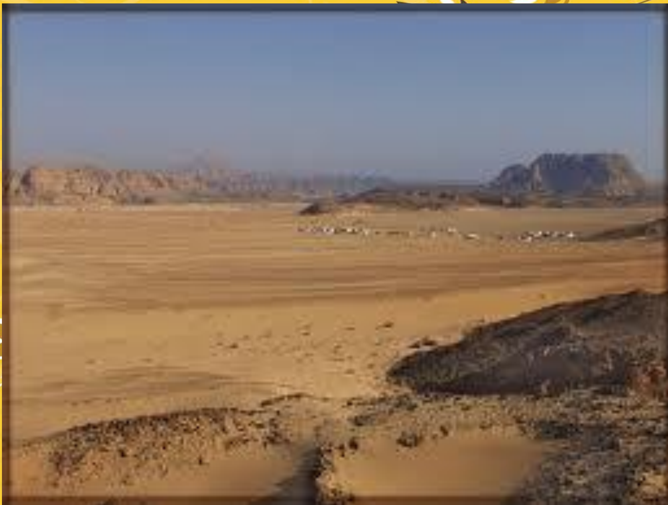
Пустыня - Виктория