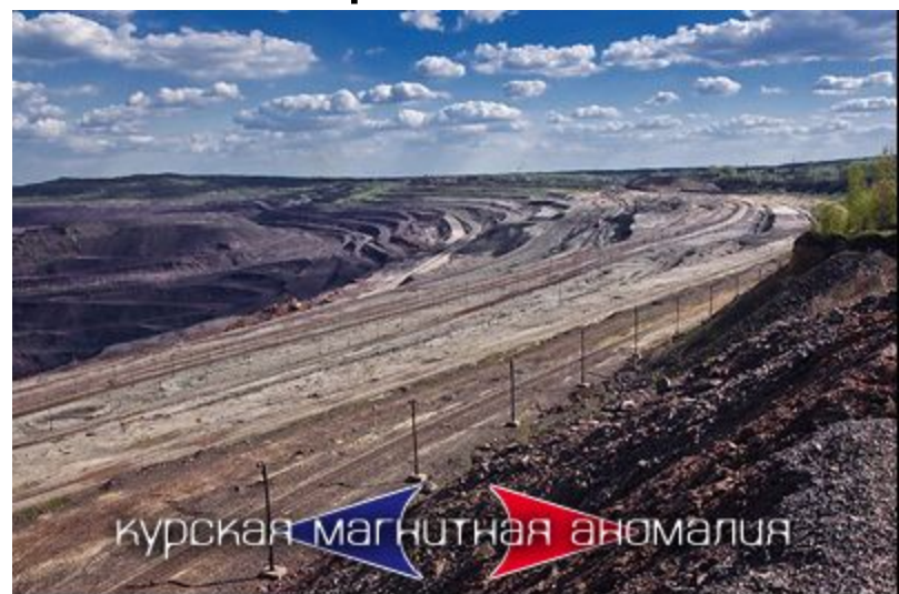
Самый мощный в мире железнорудный бассейн.

Ведущее место принадлежит черной металлургии, электроэнергетике, пищевой промышленности, машиностроению, металлообработке, промышленности строительных материалов.