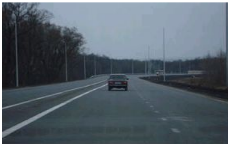
Автомобильная дорога 1Р189 в районе Старого Оскола

Климат мягкий, умеренный с продолжительным солнцестоянием (до 1800 часов в год, для сравнения в Сочи – 2185 часов) и большим безморозным периодом, плодородными черноземами (более 70% всех земельных угодий), запасами полезных ископаемых