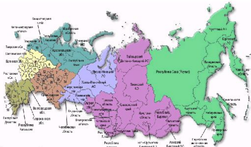
Цифрами на карте обозначены: