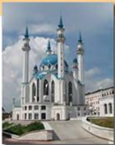
Мечеть Куд-Шариф в Казани

совершения коллективной праздничной молитвы, перед которой произносится проповедь.