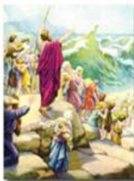
Переход евреев через Чермное (Красное) море

Итак, евреи покинули Египет. Однако фараон направился за ними в погону с войском, достигнув их у берегов моря. И Бог снова помог евреям: воды моря