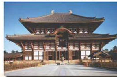
Буддийский храм в городе Нара

Каждый буддист должен также почитать три драгоценности буддизма : Будду, Дхарму и сангху . Будда – это всеведущее просветлённое существо, которое сумело достичь вершин духовного развития. Будда достиг просветления – обдхи и успокоения – нирваны , тем самым избавившись от сансары и получив освобождение. Дхарма – это Закон существования человека, открытый Буддой. Суть его изложена в четырёх благородных истинах буддизма, с которыми вы уже познакомились. Будда же сообщил Закон ученикам в виде Слова – бесед и проповедей, которые в буддизме именуются сутрами . Сутры несколько столетий передавались из поколения в поколение устно, прежде чем были записаны на специальном языке, придуманном буддийскими монахами.