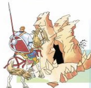
Открылся путь к пещере