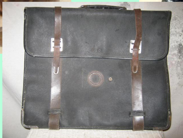
Портфель 50 -60 х годов