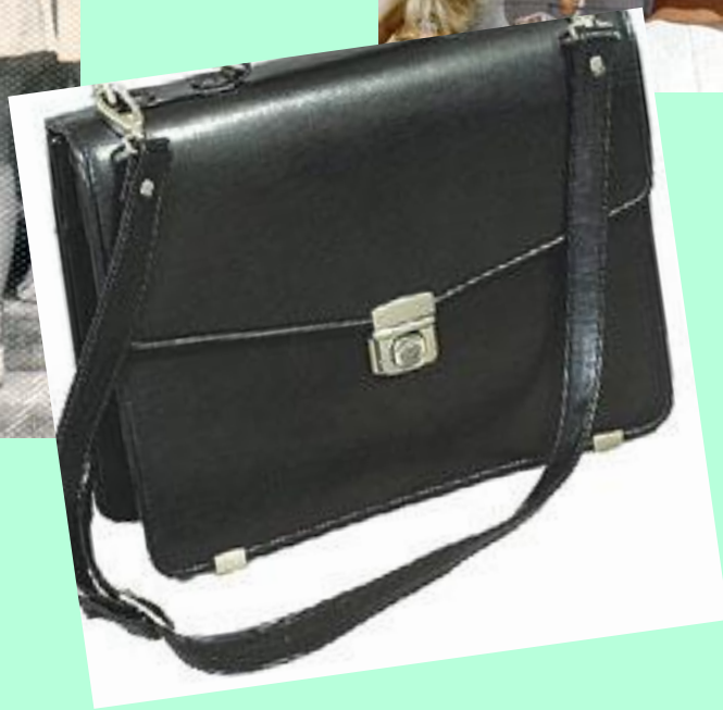
Портфель 70-х годов