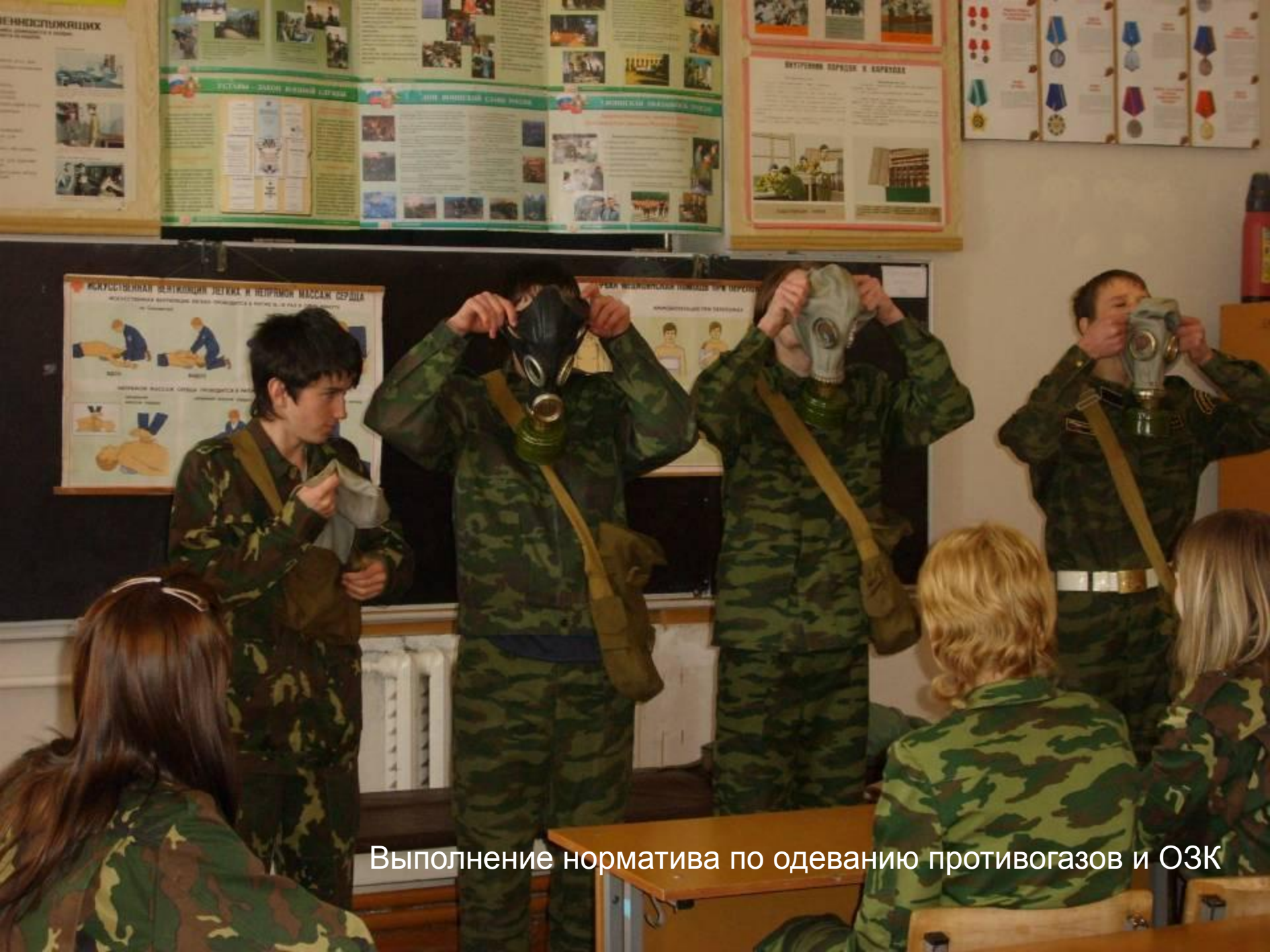
Выполнение норматива по одеванию противогазов и ОЗК