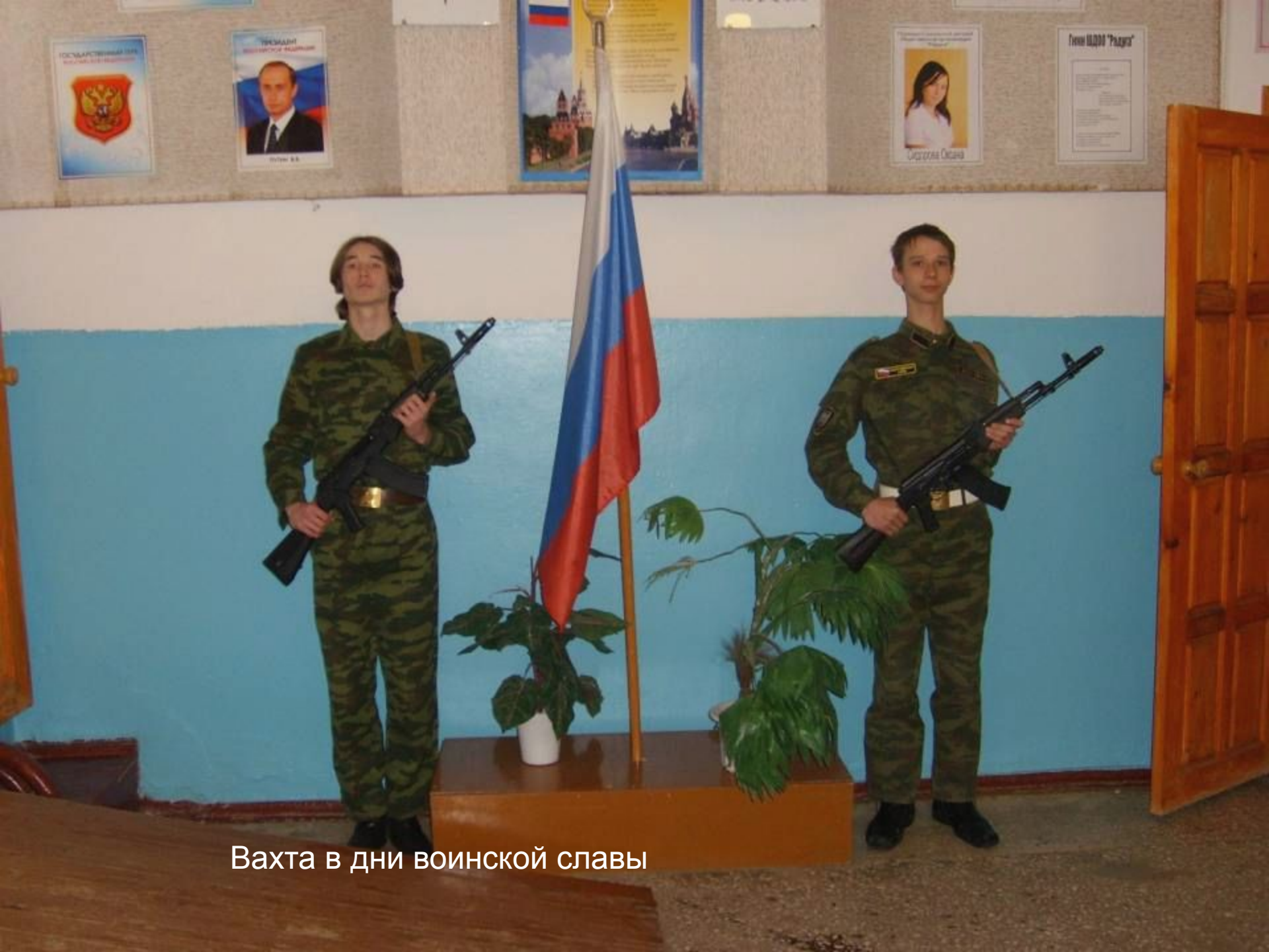
Вахта в дни воинской славы