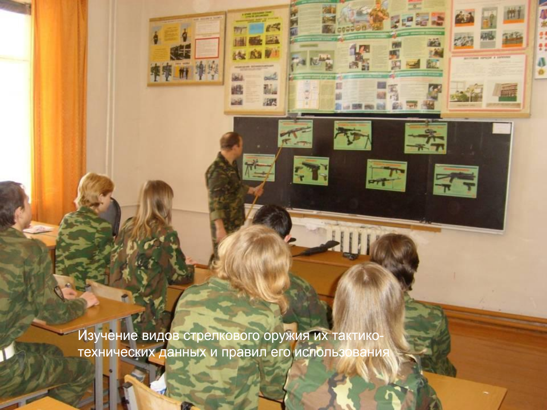
Изучение видов стрелкового оружия их тактико-технических данных и правил его использования