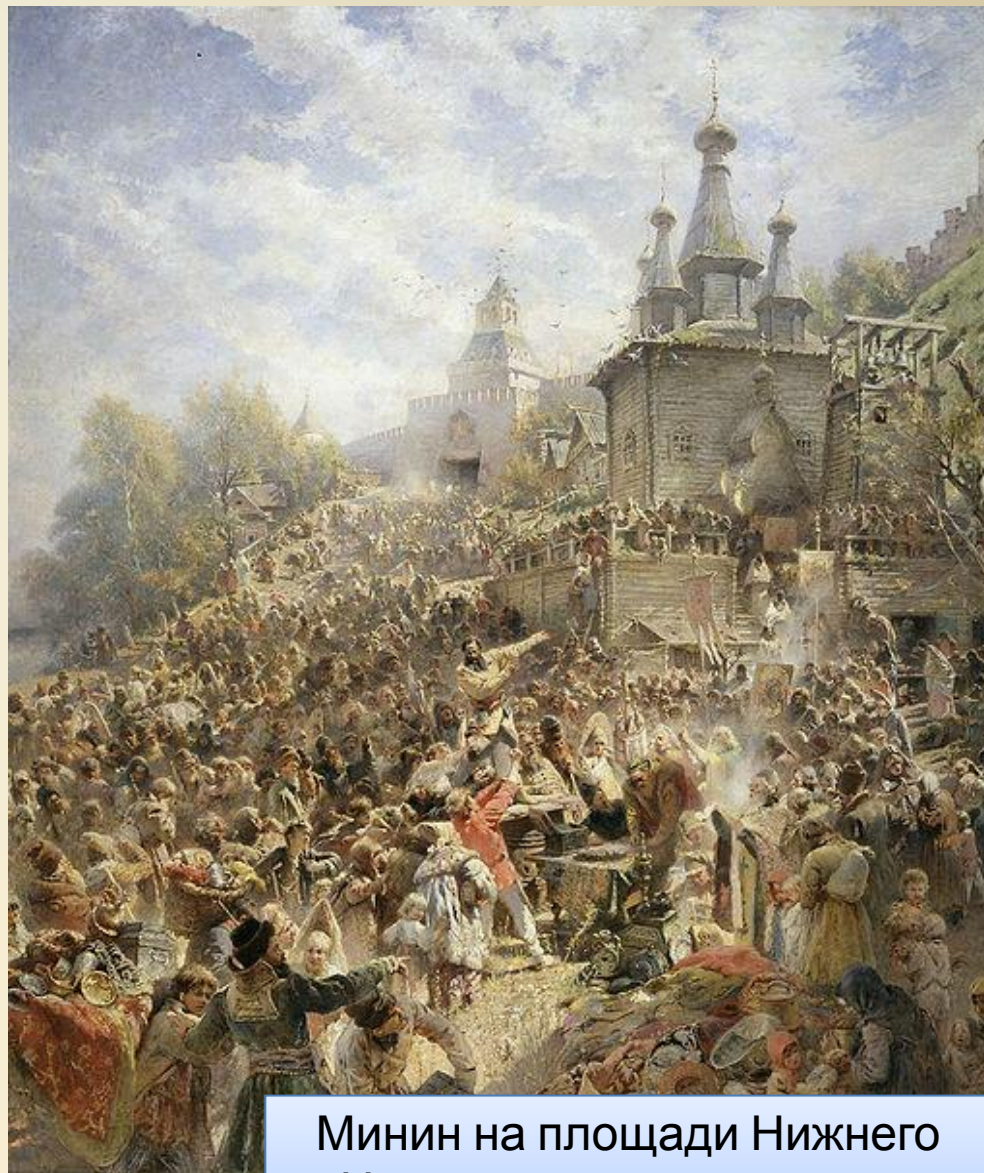
Минин на площади Нижнего Новгорода, призывающий народ к жертвованиям