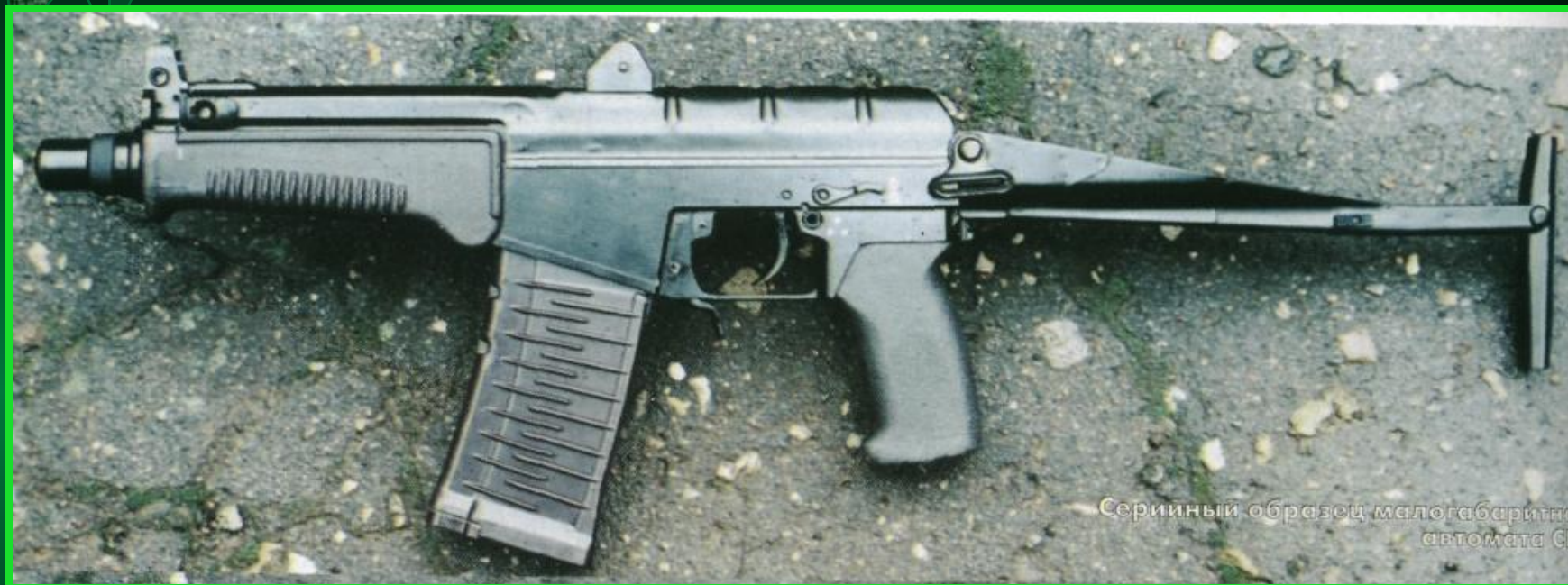
Серийный образец малогабаритного автомата СР