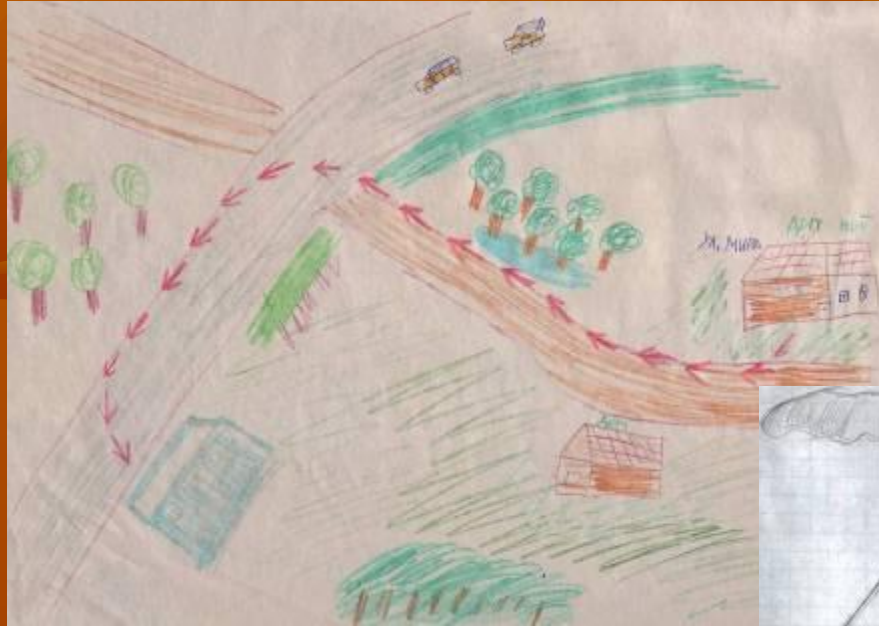
Схема маршрута «Дом – Школа»