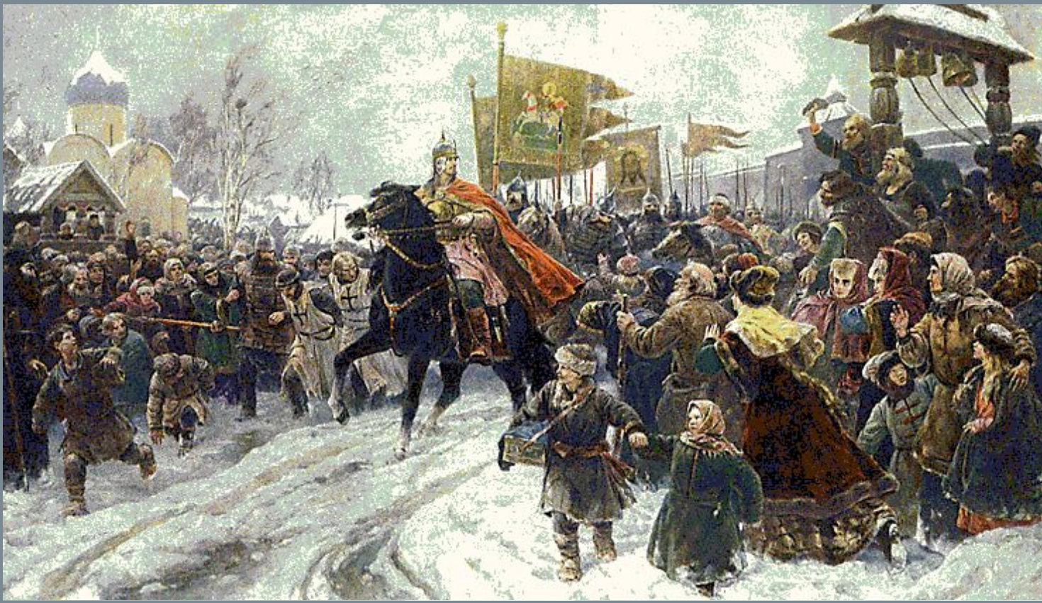
В. А. Серов. «Въезд Александра Невского во Псков»

Весной 1242 г. войско Ливонского рыцарского ордена попыталось вторгнуться в пределы русских земель. Русские дружины во главе с князем Александром Невским встретили агрессора на льду Чудского озера. Здесь 5 апреля 1242 г. произошло сражение, которое вошло в историю, под названием Ледового побоища.