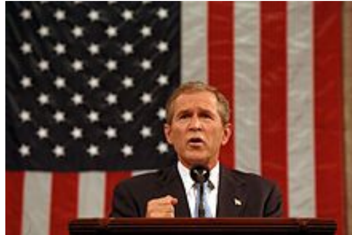
Президент Буш обращается к объединённой сессии Американского Конгресса 20 сентября 2001 года.

«Это второй Пёрл-Харбор. Я не думаю, что преувеличиваю» (Чак Хагел).