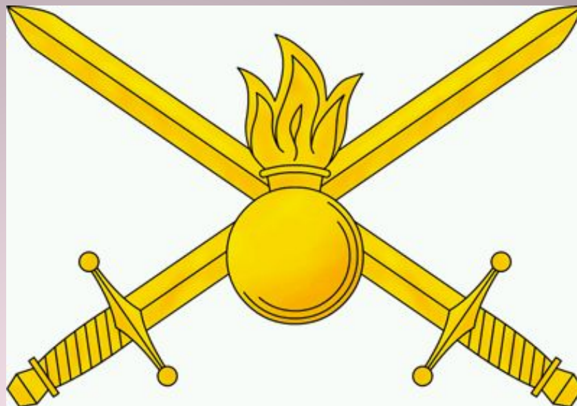
Малая эмблема СВ