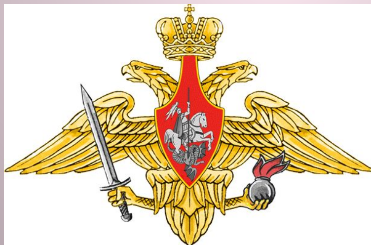
Средняя эмблема СВ