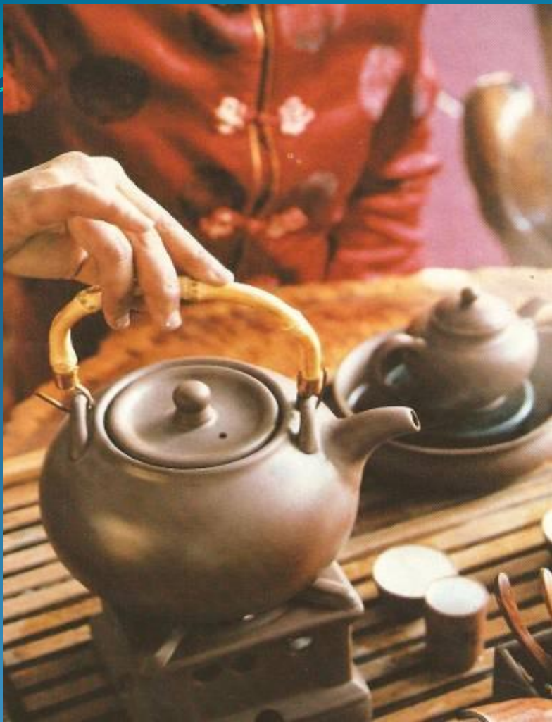
Чайник для кипячения, заварочный чайник