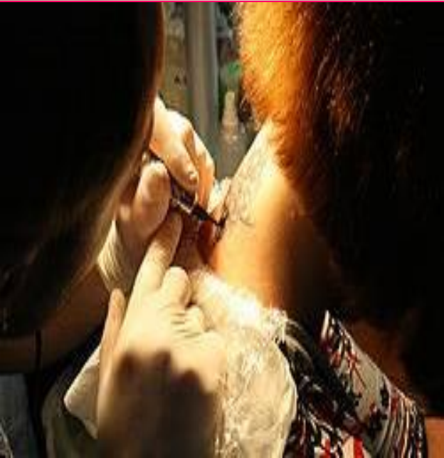
Процесс нанесения татуировки