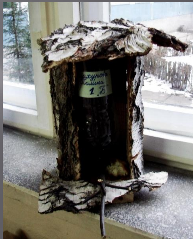
ШАХУРОВА ПОЛИНА, 1 «Б»