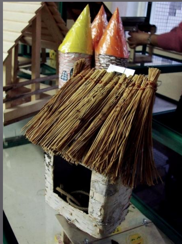
ТВЕРДОХЛЕБОВ А, 2 «В»