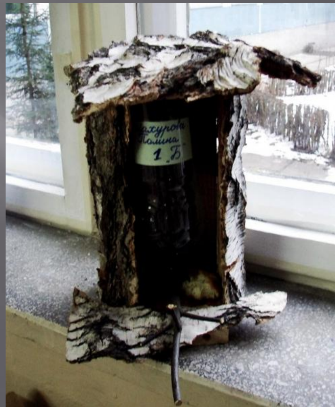
ШАХУРОВА ПОЛИНА, 1 «Б»