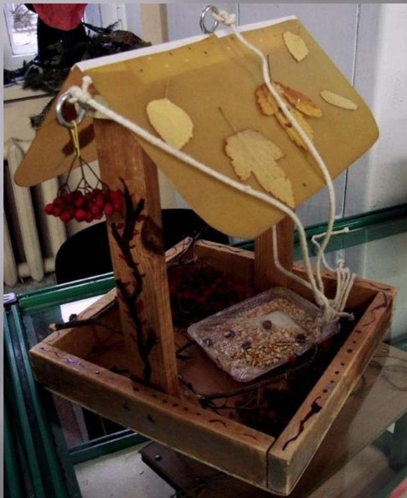
БАЖАН ДЕНИС, 1 «В»