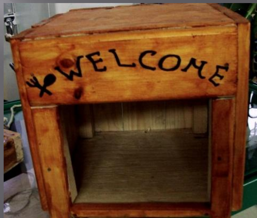
ЛЕОНОВ НИКИТА, 3 «Г»