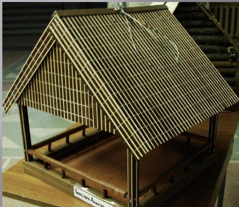
ТВЕРСКИХ АНДРЕЙ, 1 «Г»