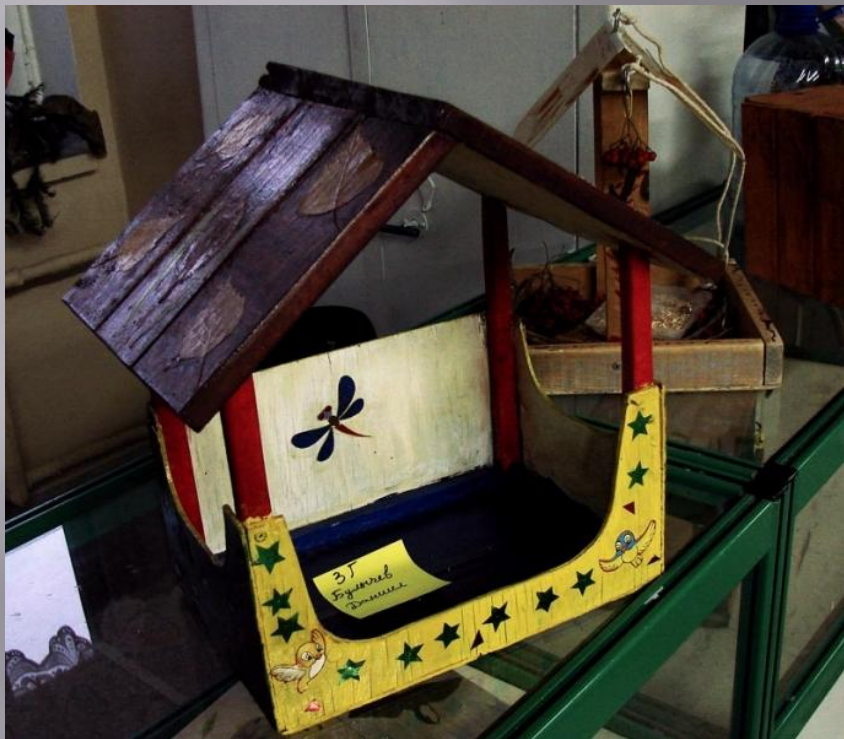
БУЛЫЧЁВ ДАНИИЛ, 3 «Г»