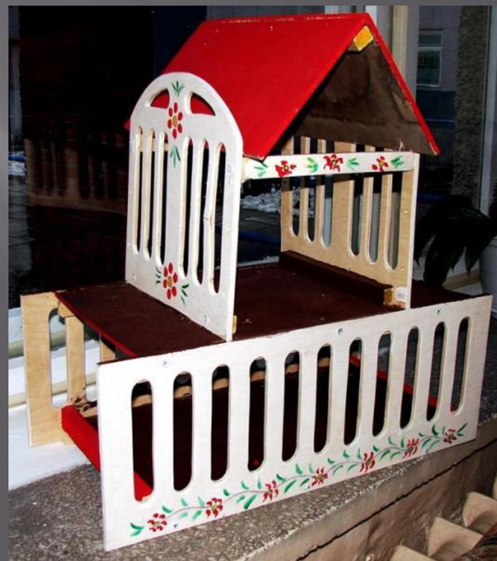
БАРАНОВА САНДРА, ВАНИЧЕНКО СЕВА, 3 «Б»