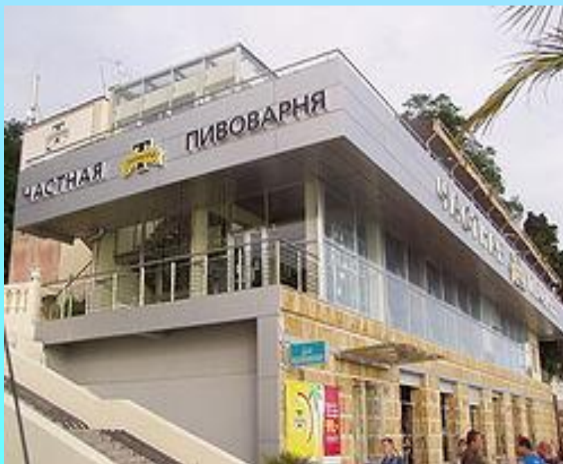
Ресторан на набережной